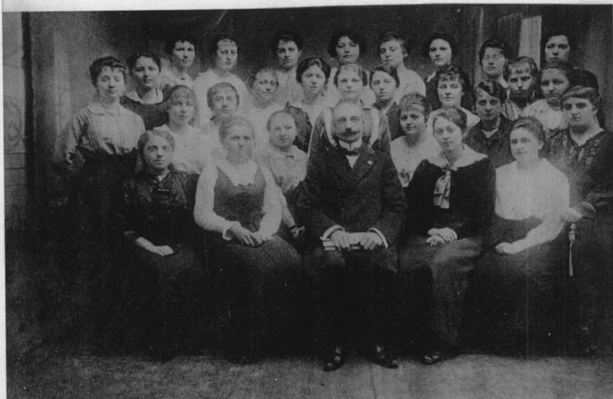
18. Vrouwelijke vrijwilligers EHBO van het Rode Kruis, afdeling Oostende