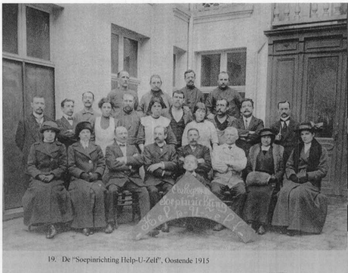
19. De "Soepinrichting Help-U-Zelf", Oostende 1915