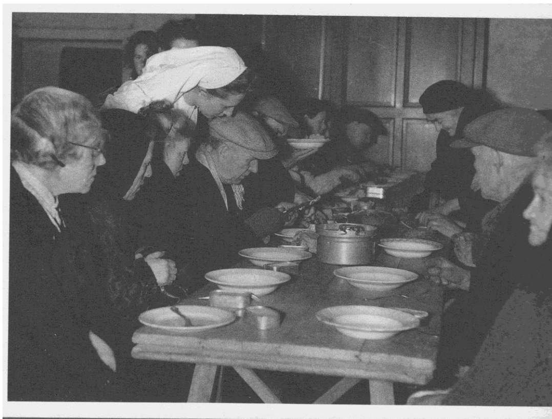
Gratis maaltijden voor behoeftigen