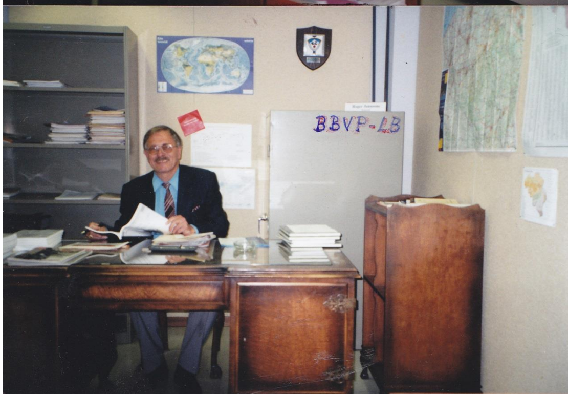
“Nalatenschap “ van NLVC/Winterhulp: crisismanagement als een “Janus met 2 gezichten”: bovengronds & ondergronds (1951-2000)