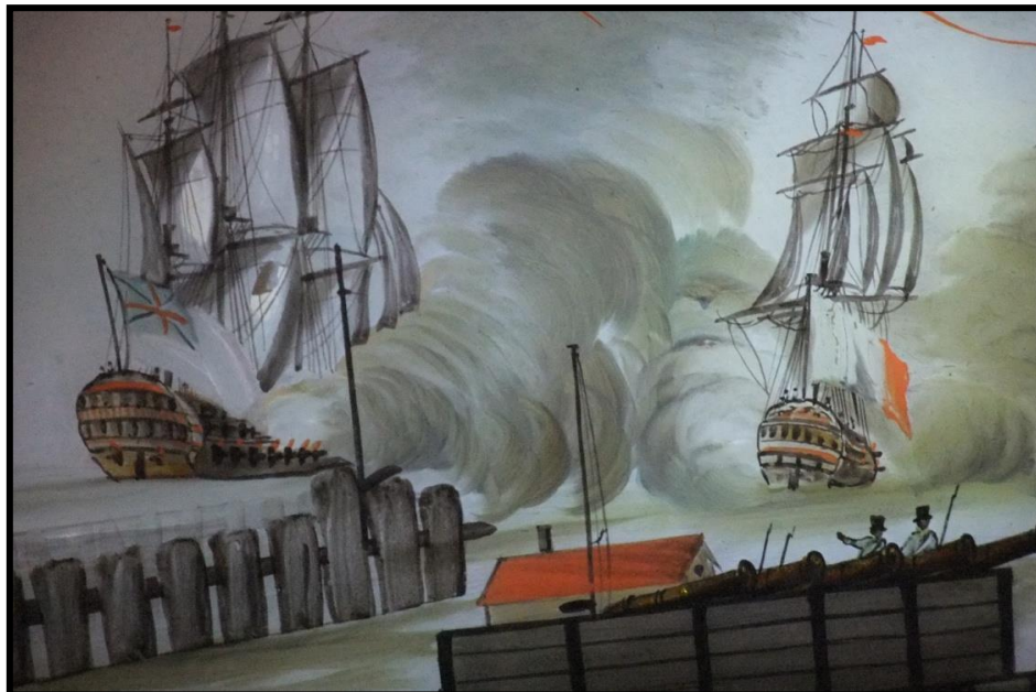
Zeegevecht tussen Engelsen en Fransen. Detail uit achterglasschilderij 'De Haven van Oostende', W. Wieden, 1813. (in De Plate juni 2012)

Op 18 mei 1804 wordt Napoleon door de Senaat, tot Keizer uitgeroepen. In augustus 1804 bezoekt Napoleon voor de derde keer Oostende, ondermeer voor een algemene inspectie van de vestingwerken. Napoleon zal in december 1804 tot Keizer gekroond worden.