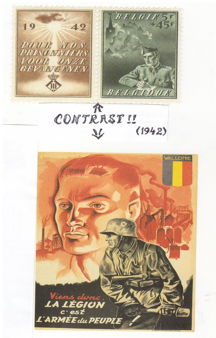
Propaganda voor het Oostfront