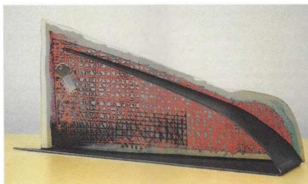
Het kunstwerk, ontworpen door Etienne en Tim De Vis (Gard' Plastiq)

Het Bestuur van De Plate wenst zijn voorzitter uiteraard van harte proficiat met deze uitzonderlijke prijs en wij durven eraan toevoegen “doe zo voort !!”.