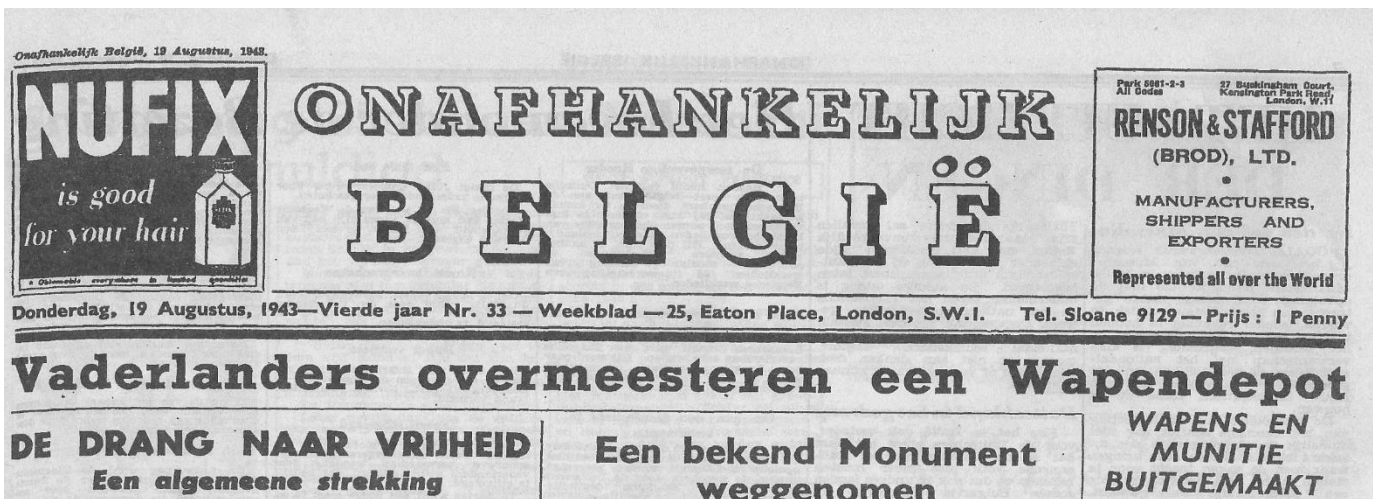
“Onafhankelijk België” van 19 augustus 1943