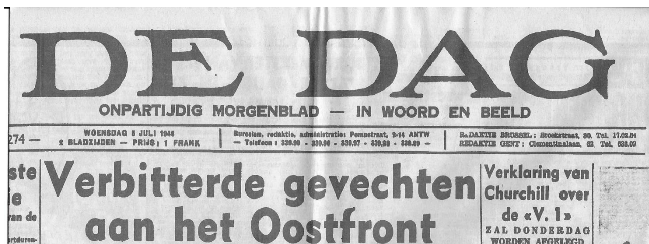
“De Dag” van 5 juli 1944