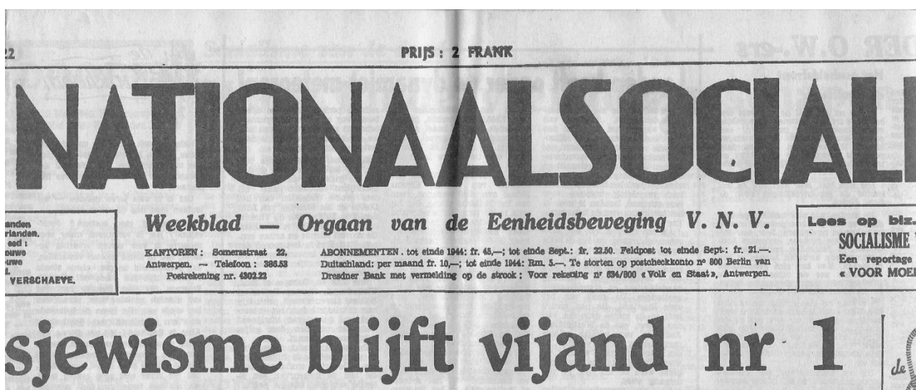
“De Nationaal Socialist” van 24 juni 1944