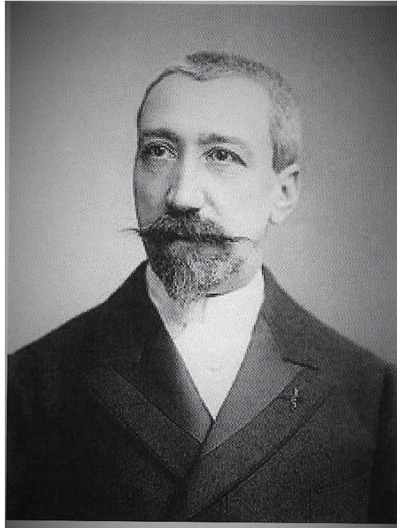
Anatole France bij het begin van zijn loopbaan. Portret door Wilhelm Benque. Tucker Collection, New-York Public Library Archives (Wikipedia).