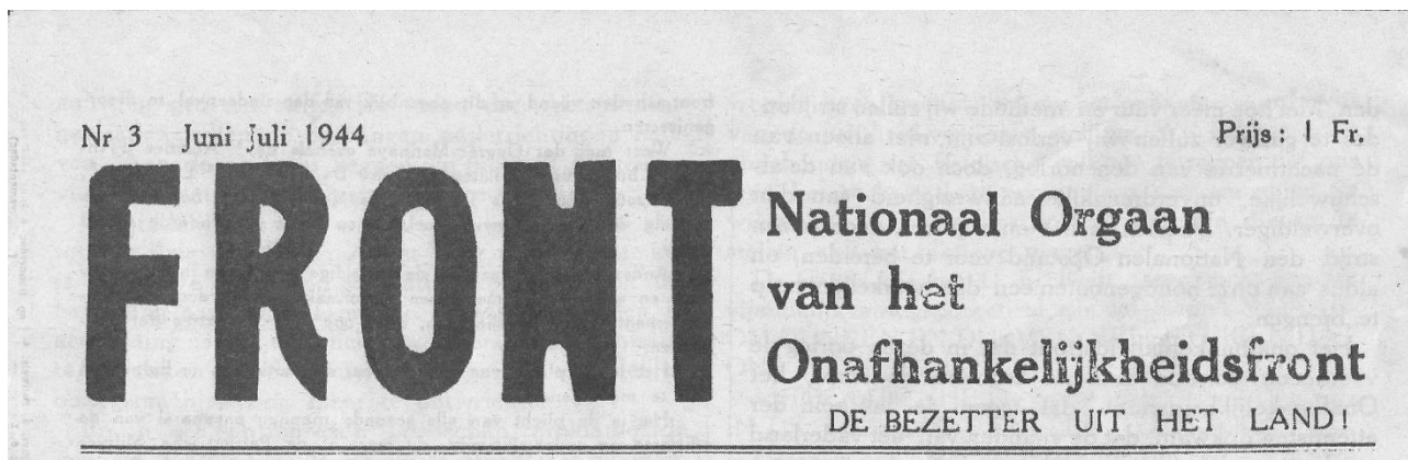
Front van juni/juli 1944