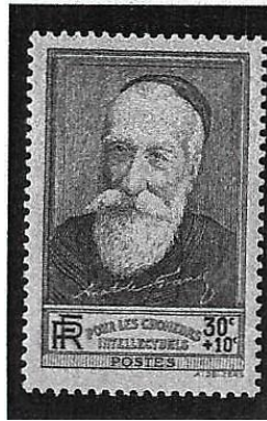
Franse postzegel met de beeltenis van Anatole France, uitgegeven in 1937 ten voordele van de werkloze intellectuelen (catalogus Yvert nr. 343). Dezelfde afbeelding verscheen in 1938 (Yvert nr. 380). (Verzameling Yves Dingens).