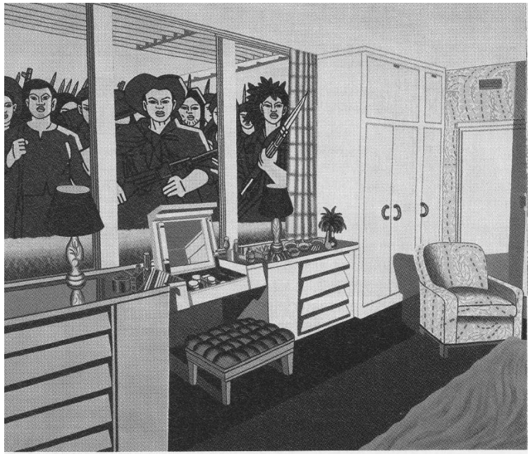
“American interiors” popart van Eco (1986)