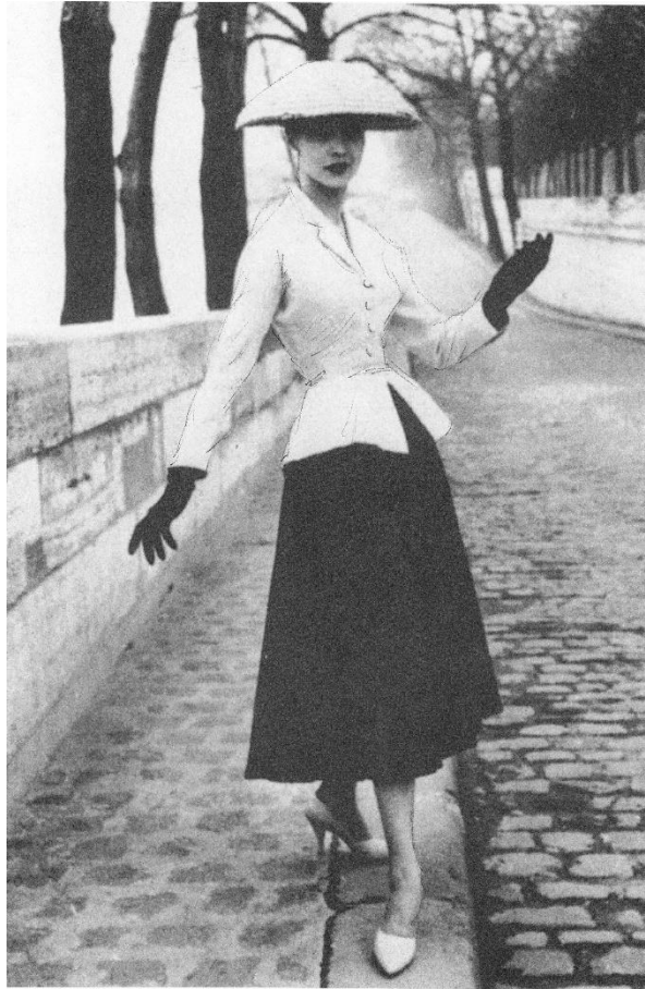
Invloed van de “zazous” op de “haute couture”: de “Dior look” (1947)