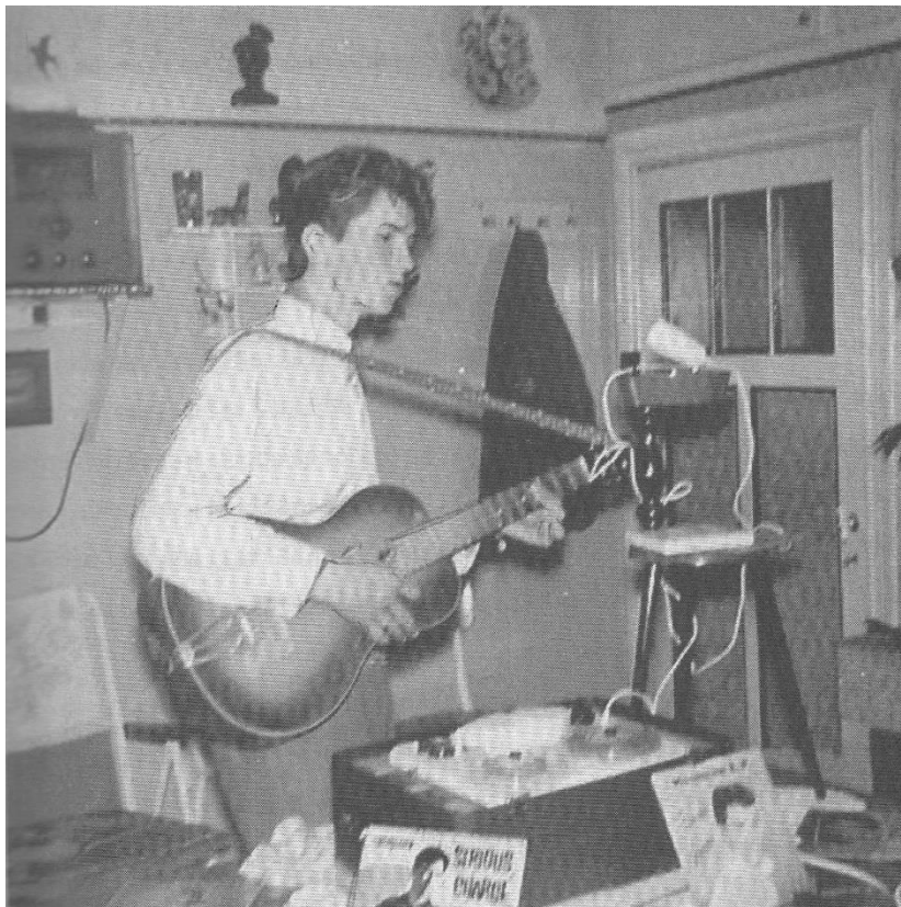
Geboorte van Oostende rock in een keukentje (1956)