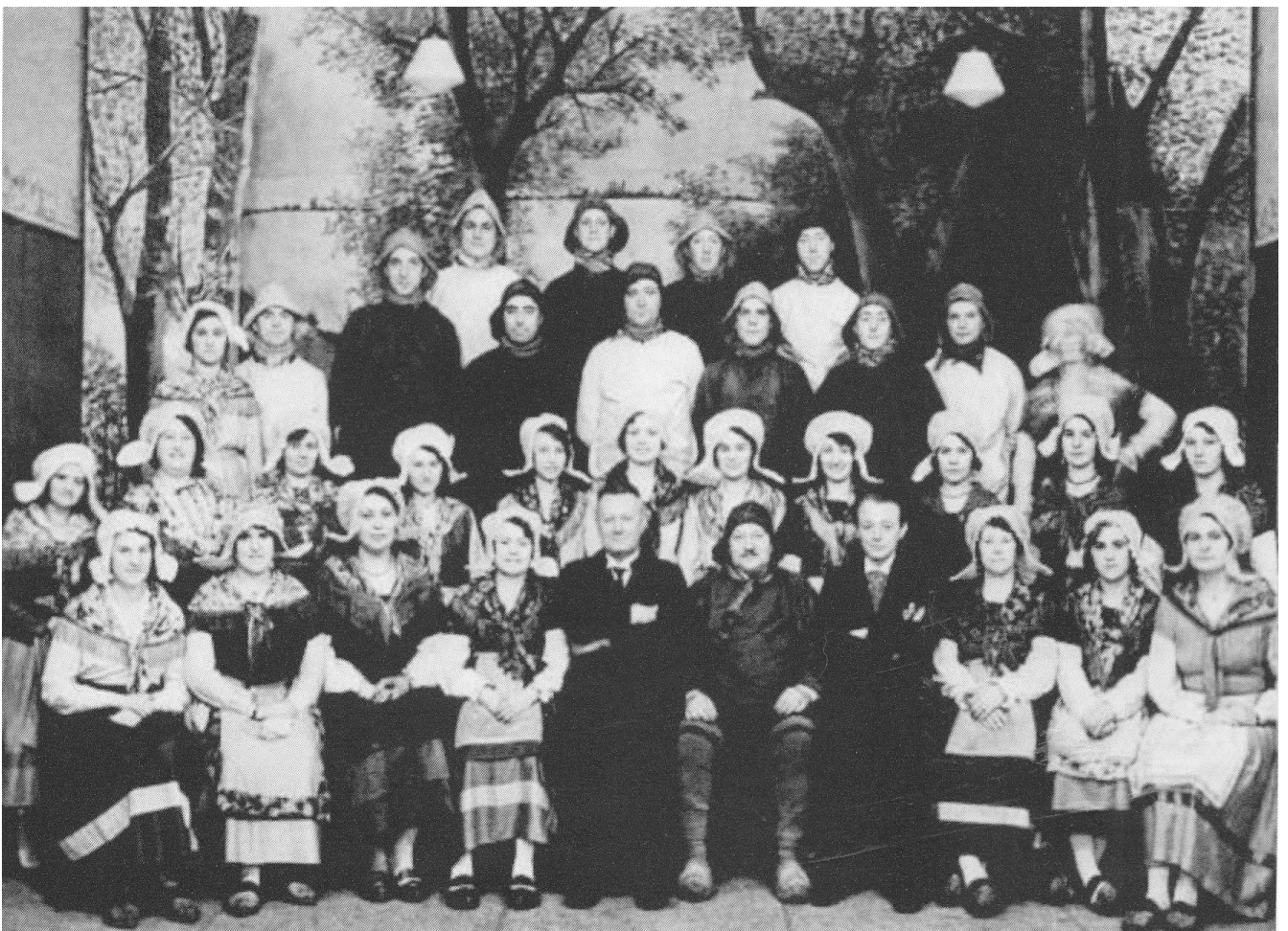
Zangvereniging “Het Looze Visschertje” (1933)