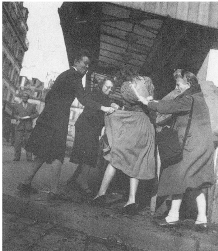
“shoking”? – Parijs rue Lepic: haat tegen de “new look” van Dior !