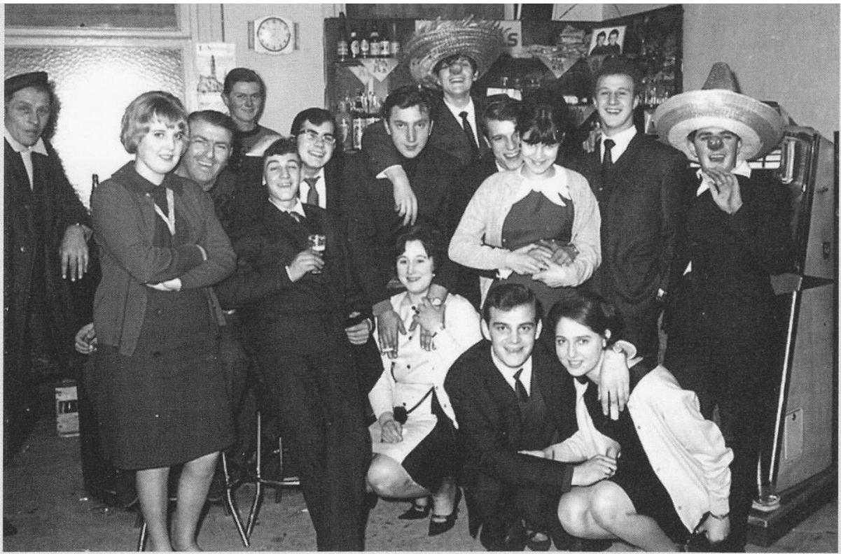
1964: vrolijke rockfans in het Visserskwartier !