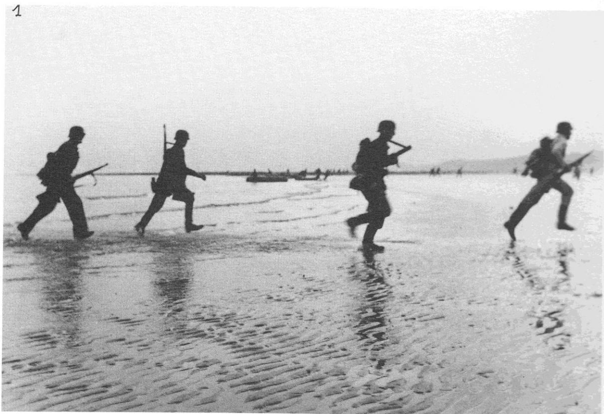
Landingsoefening op de Oosteroever voor operatie "Seelöwe" (augustus 1940)