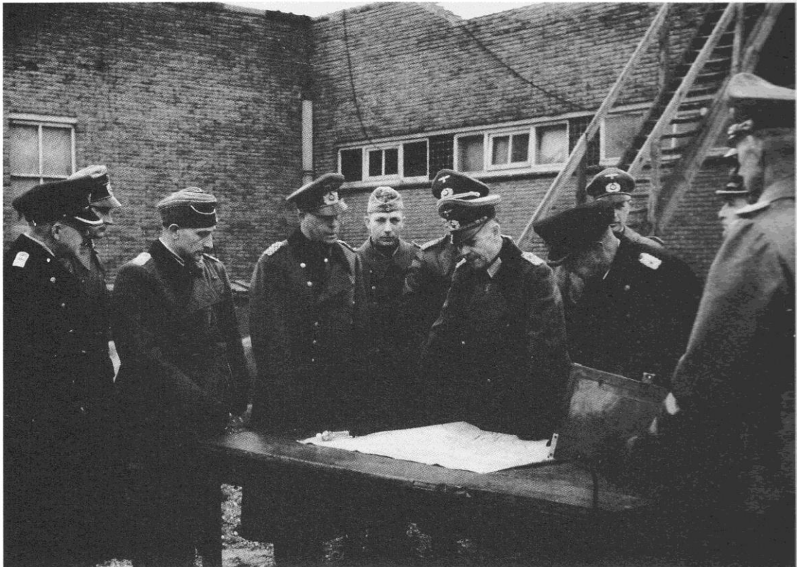
Inspectie Veldmaarschalk von Rundstedt in de Marineschool in Oostende (29.01.1943)