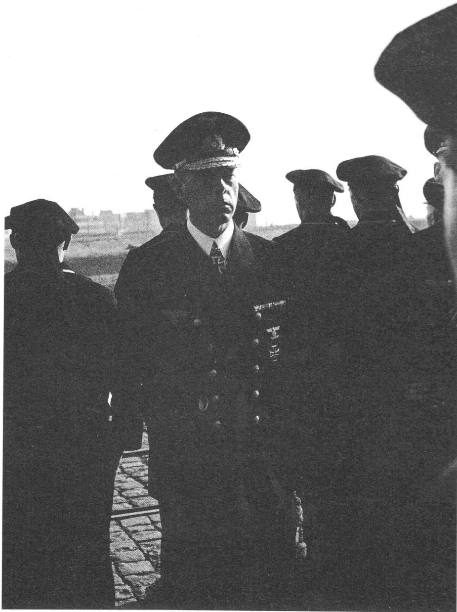
Bezoek Vice-Admiraal Lütjens aan de haven van Oostende (10.06.1940)