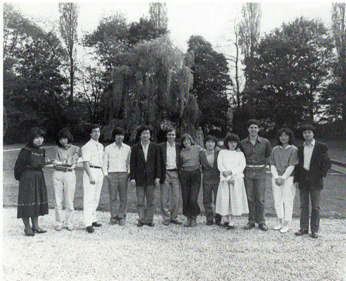
Les douze lauréats à la Chapelle musicale Reine Elisabeth