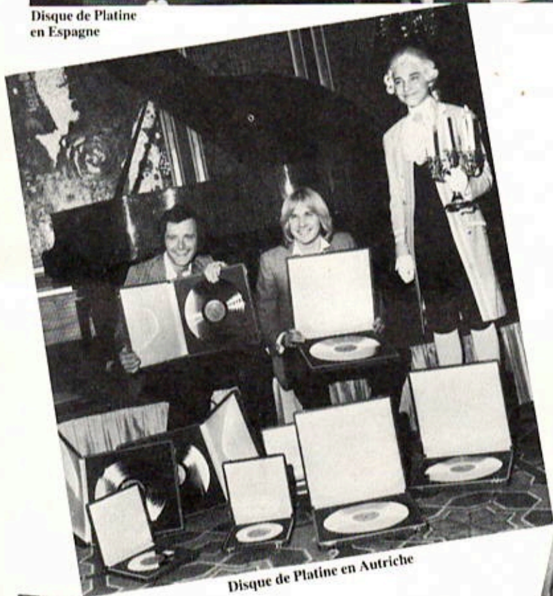
Disque de Platine en Autriche