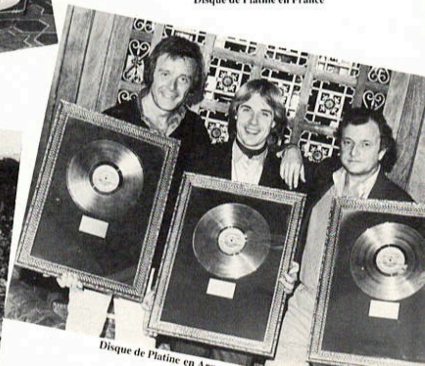
Disque de Platine en Allemagne