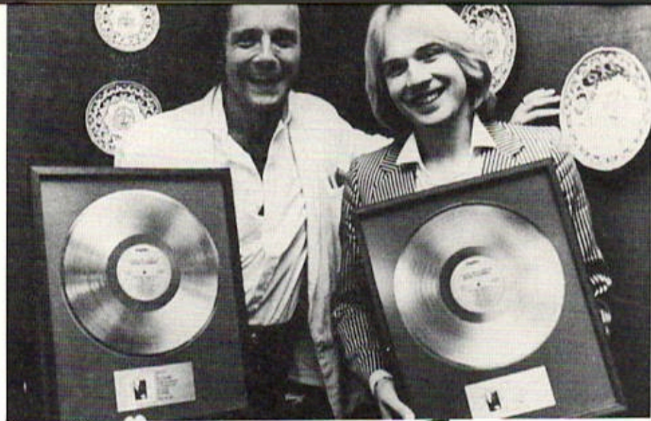
Disque de Platine en Espagne