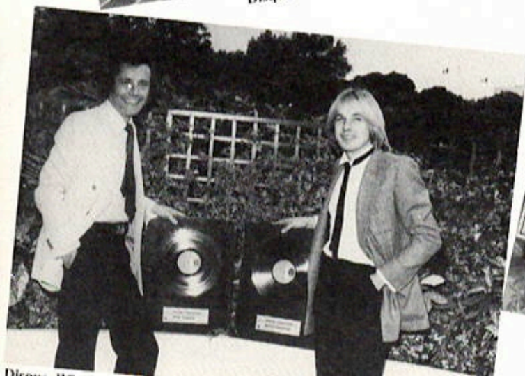
Disque de Platine en Espagne