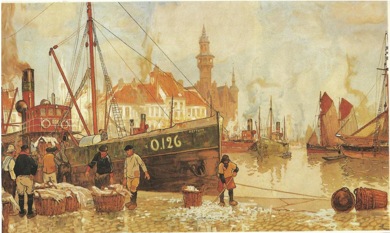
DE VISSERSHAVEN VAN OOSTENDE

“Karoen in ’t aanschijn van de zee. Levensroman” is duidelijk een vitalistische roman. De