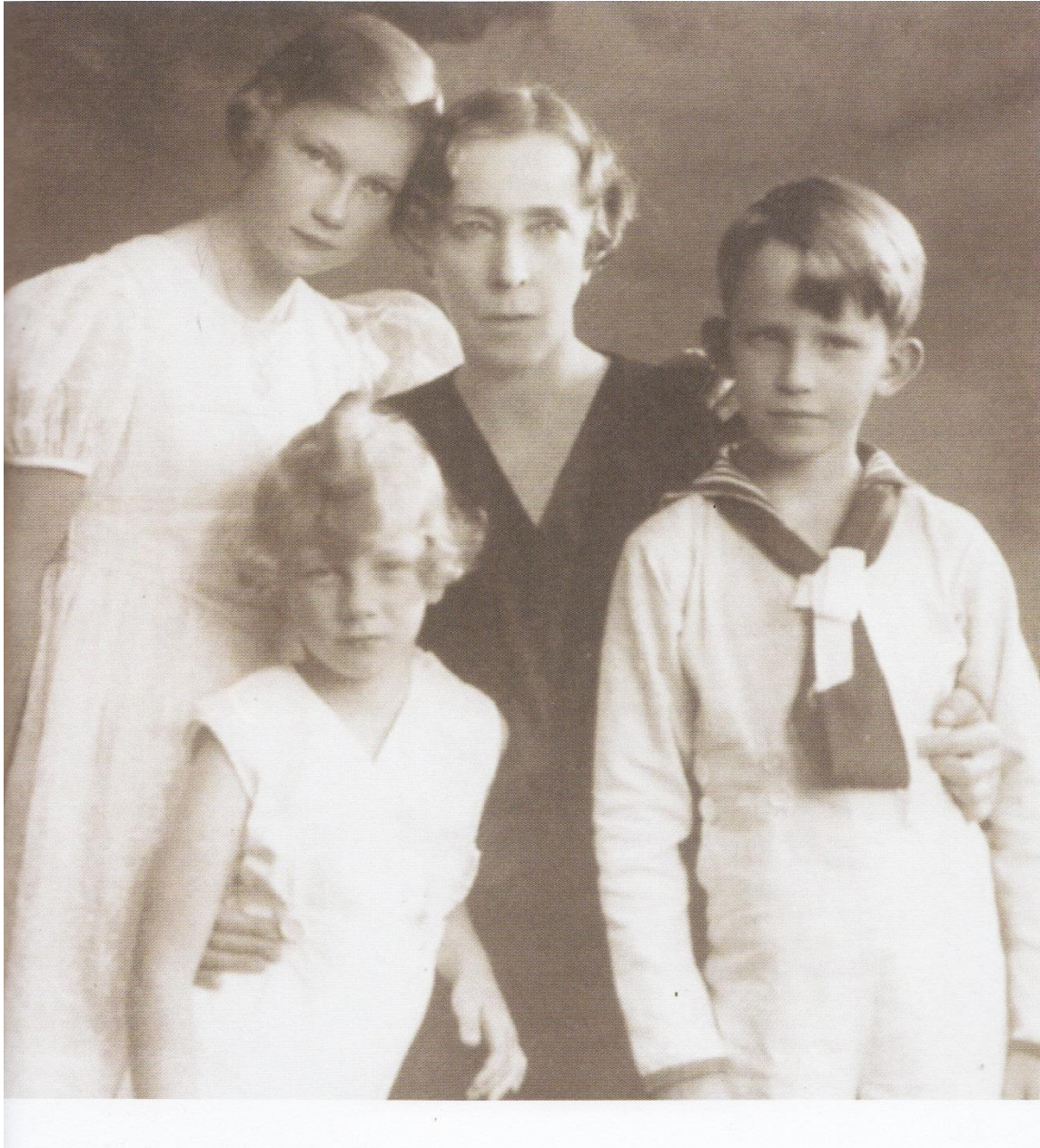
Koningin Elisabeth als grootmoeder samen met haar kleinkinderen (1938)