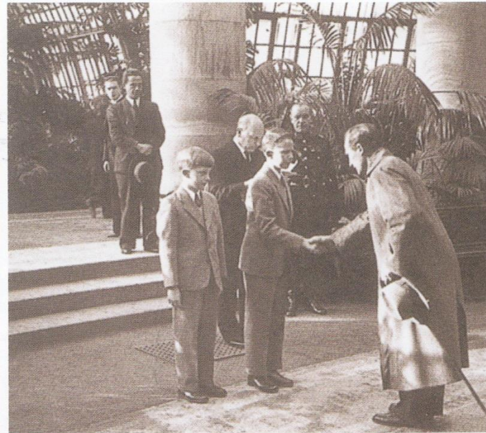
Actie "Garve des Konings": prins Boudewijn ontvangt delegaties (23 maart 1943)