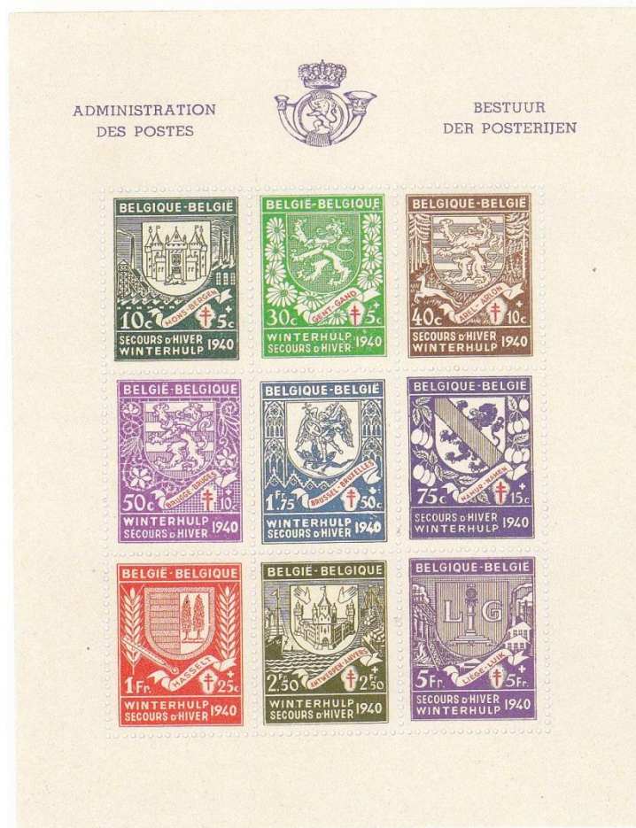
Postzegels ten voordele van Winterhulp (1941)