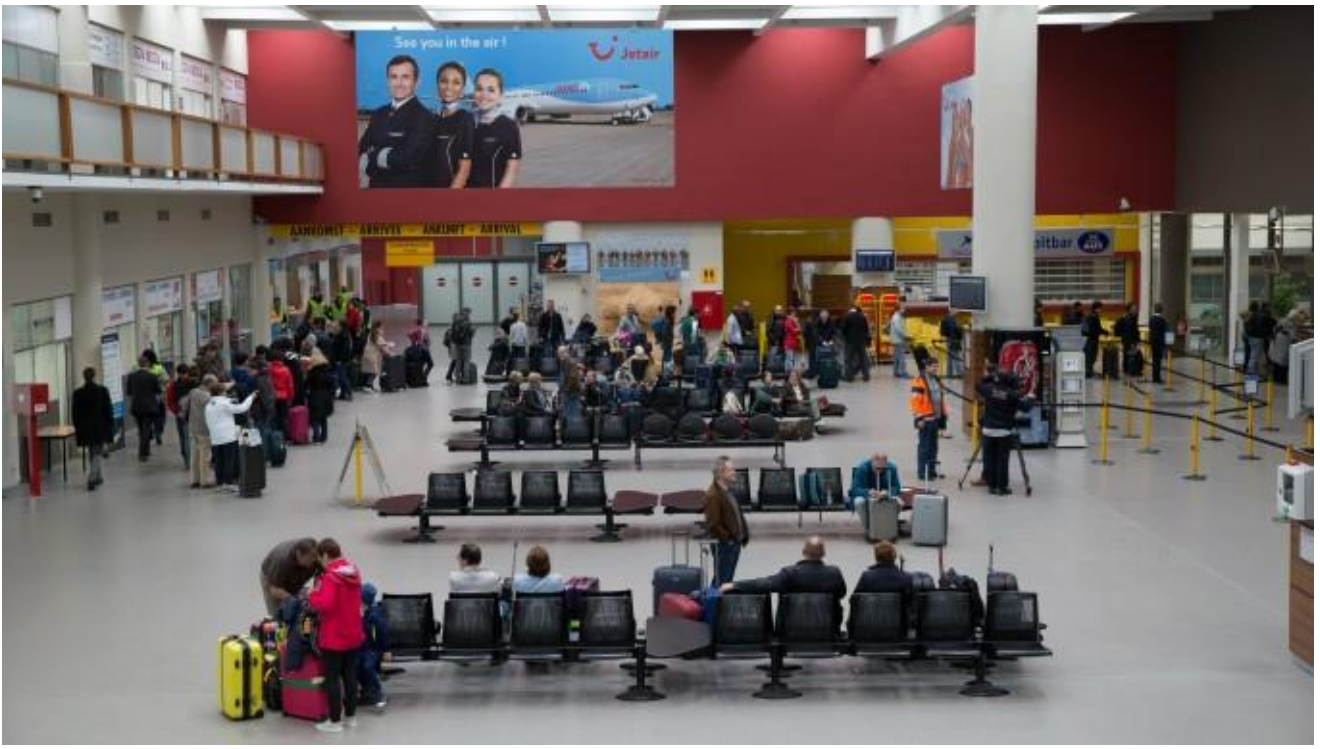
Binnenzicht hall luchthaven Oostende-Brugge