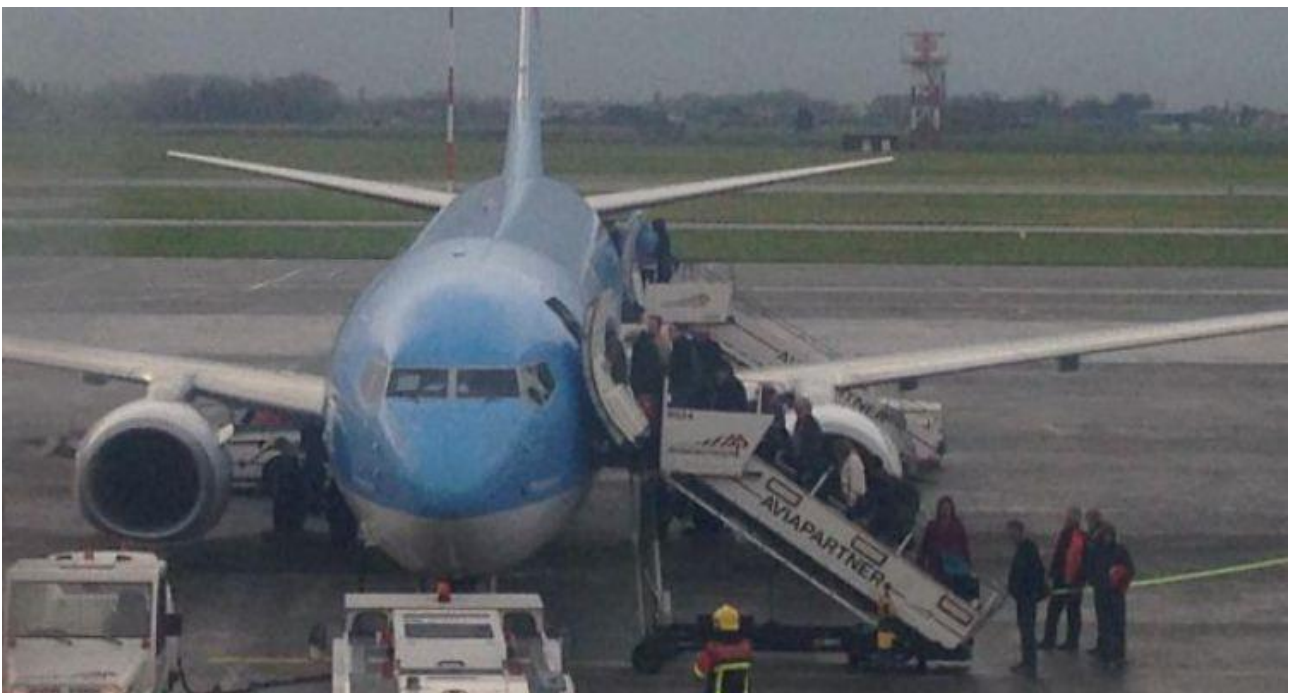
Oostende. Inname passagiers