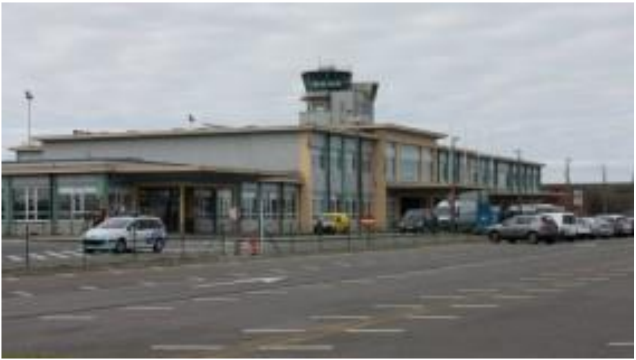
Voorplan luchthaven gebouw Oostende