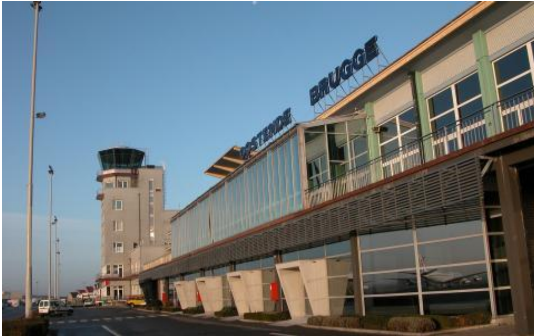
Airport building Ostend Airport

En op het bidprentje had zijn echtgenote Kathleen volgend pregnant tekstje neergeschreven, o.m. “bij het openen van een fles wijn zei je telkens “carpe diem” [pluk de dag] want het kan de laatste zijn. Ché, ik mis je zo en nu besef ik door hoeveel anderen je ook gemist zal worden” .