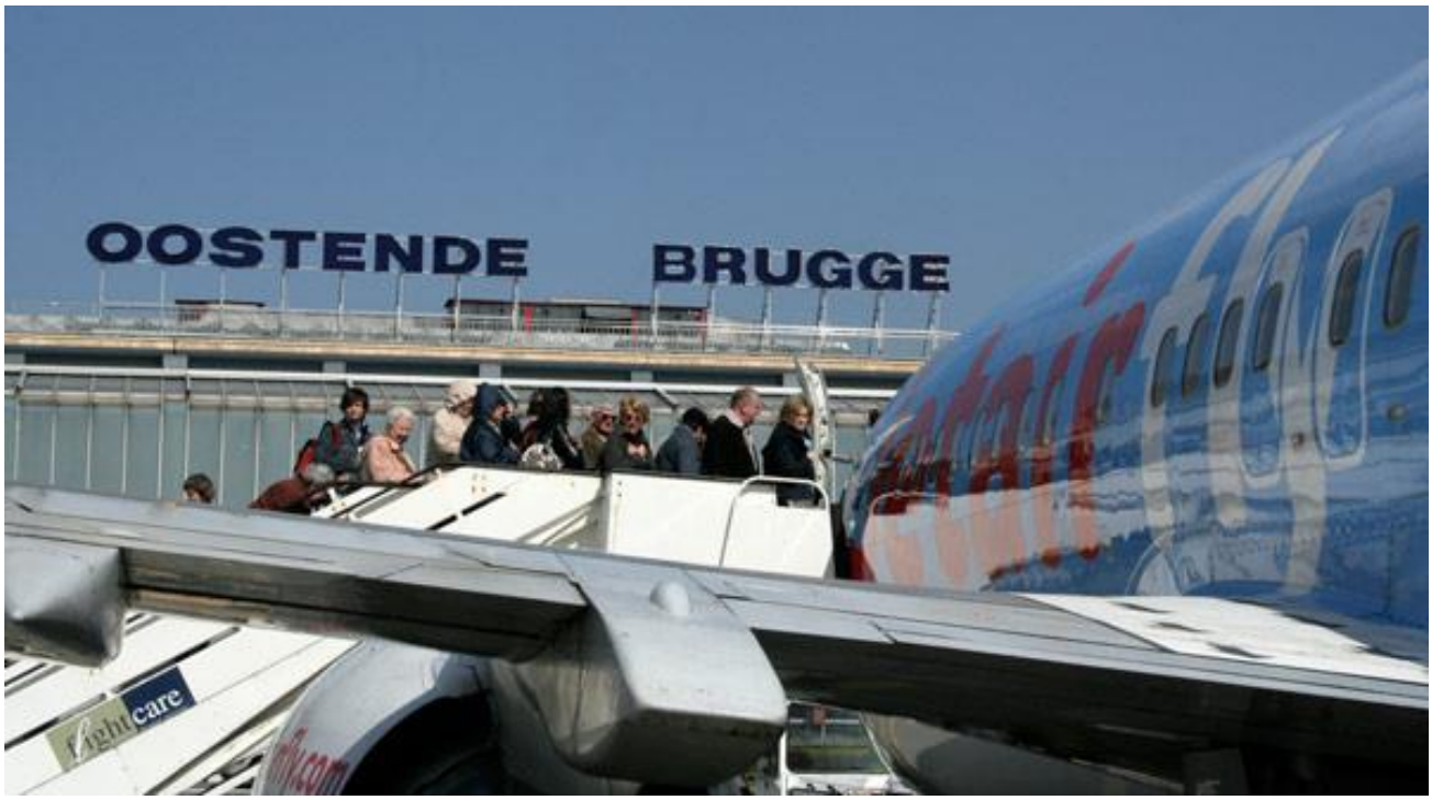
Oostende. Inname passagiers