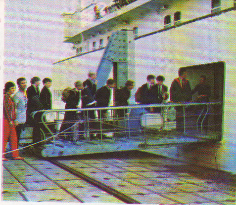
Te Oostende en te Dover leggen de passagiersschepen aan vlakbij de treinen. Hetzelfde geldt voor de carferries te Harwich.