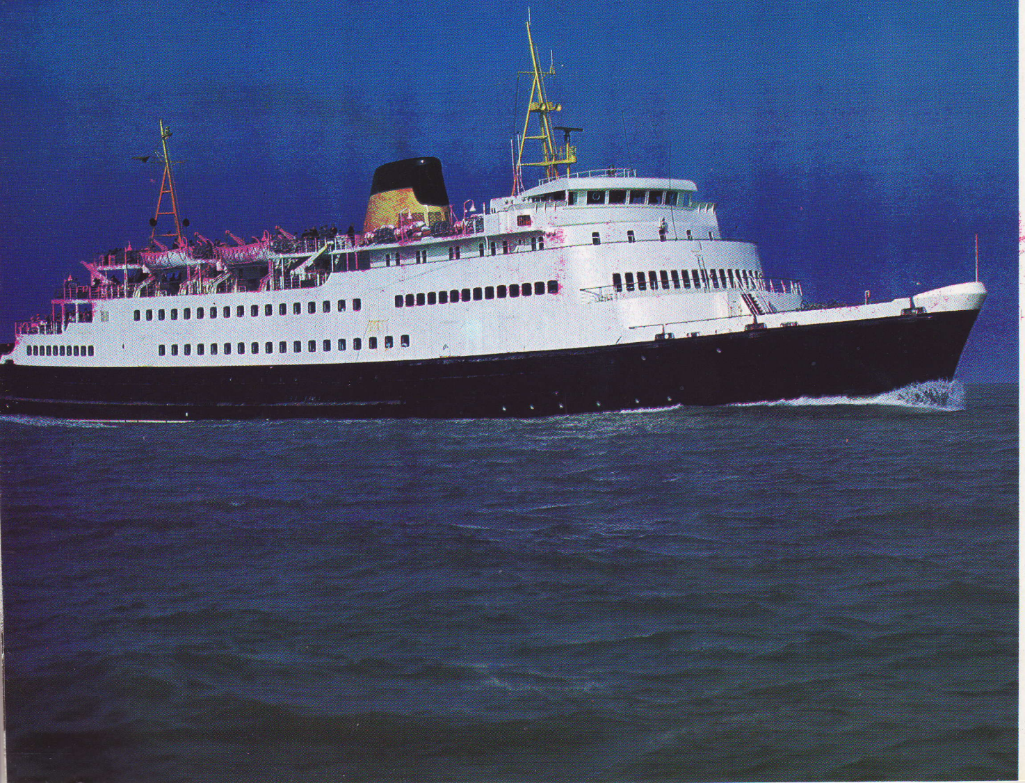
Pakketboot «Prinses Pa...