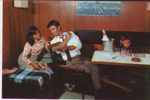
Indien U de meer intieme sfeer verkiest kunt U mits betaling van een toeslag een ruime afzonderlijke hut betrekken.