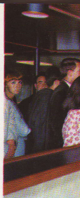
Een uitgebreide keuze taksvrije « shop » met

Uitstekende rechtstreekse sneltreinverbindingen bestaan tussen Oostende en de belangrijkste hoofdsteden van Europa. Te Dover geven speciale sneltreinen aansluiting naar en van Londen. Te Oostende sluit het carferry-station rechtstreeks aan bij de E5 autosnelweg naar Brussel.