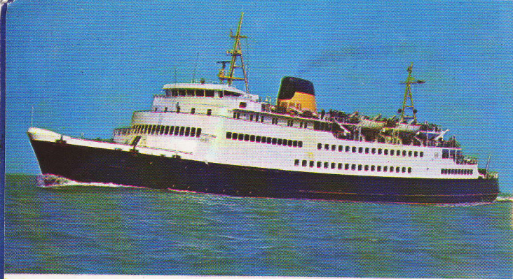
Er is de niet te miskennen aantrekkingskracht van een zeereis op een groot schip dat alle waarborgen biedt inzake veiligheid en comfort.