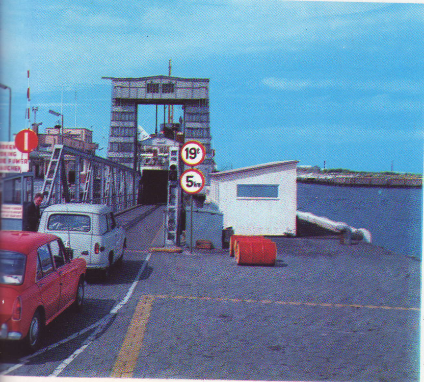
op en af de carferries zodat zijzelf evenals de inzittenden in het voertuig kunnen blijven, beschut tegen n. Dit systeem waarborgt tevens een vlotte in- en ontschepping zonder risico van beschadiging.