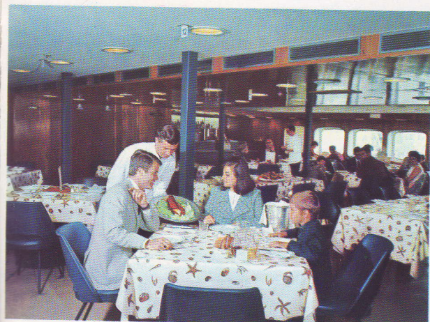
en comfortabele diensten op Engeland.