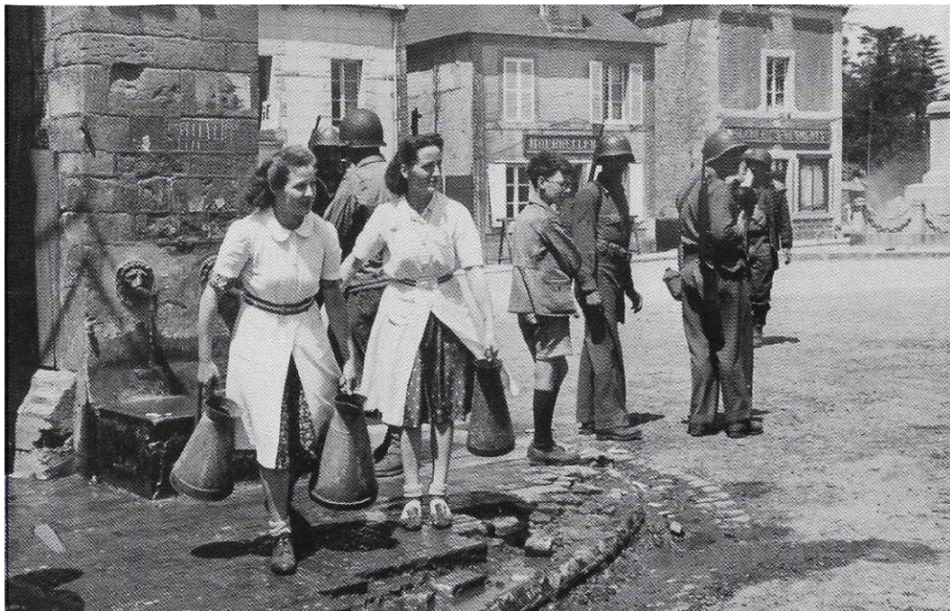
Normandië 1944: water halen onder militaire escorte