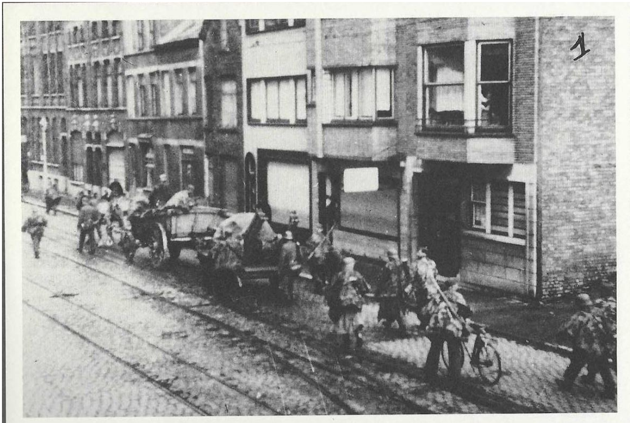
Oostende Nieuwpoortsesteenweg: een achterhoede trekt zich terug, richting Petit Paris