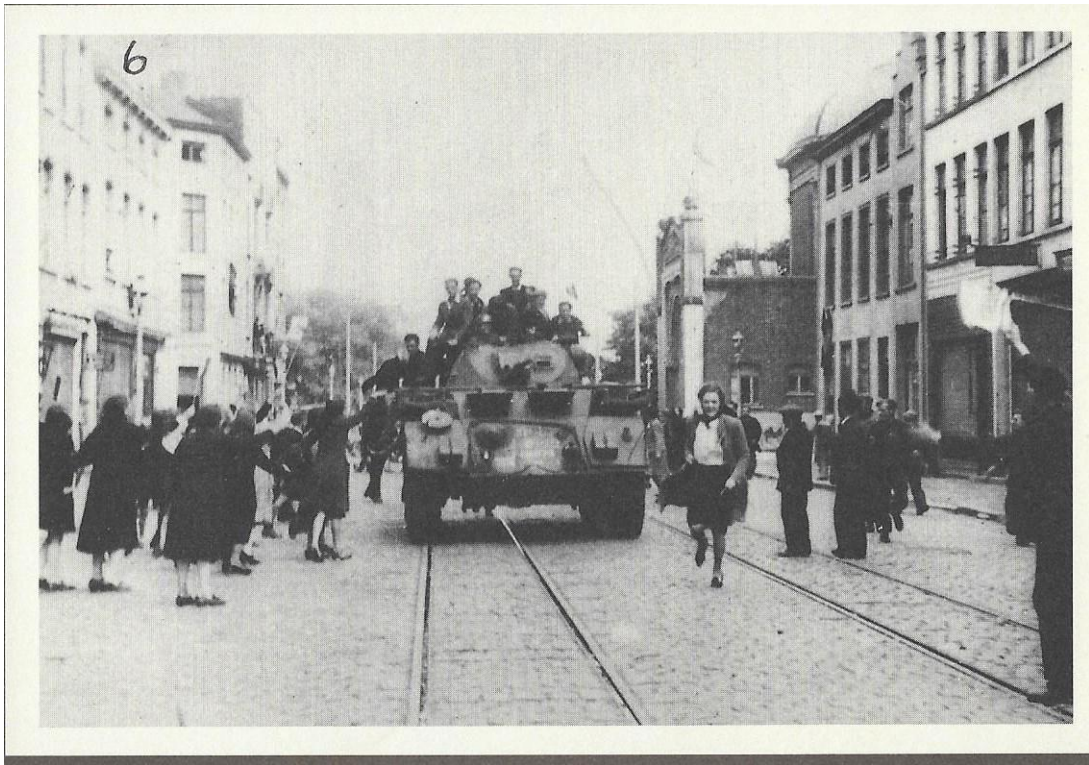
Canadese tanks bij het huidige Canadaplein