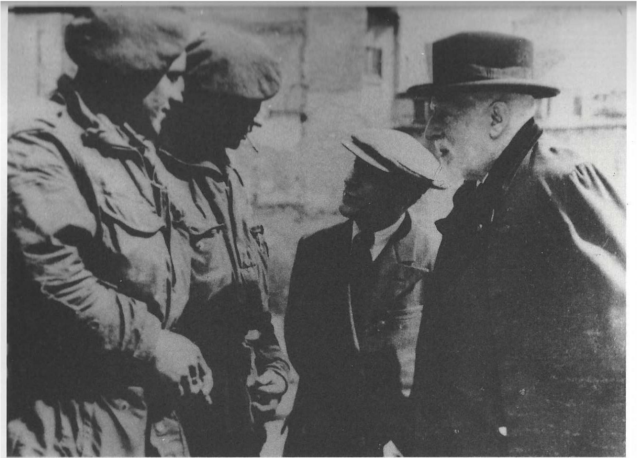
Ensor in gesprek met Canadese soldaten