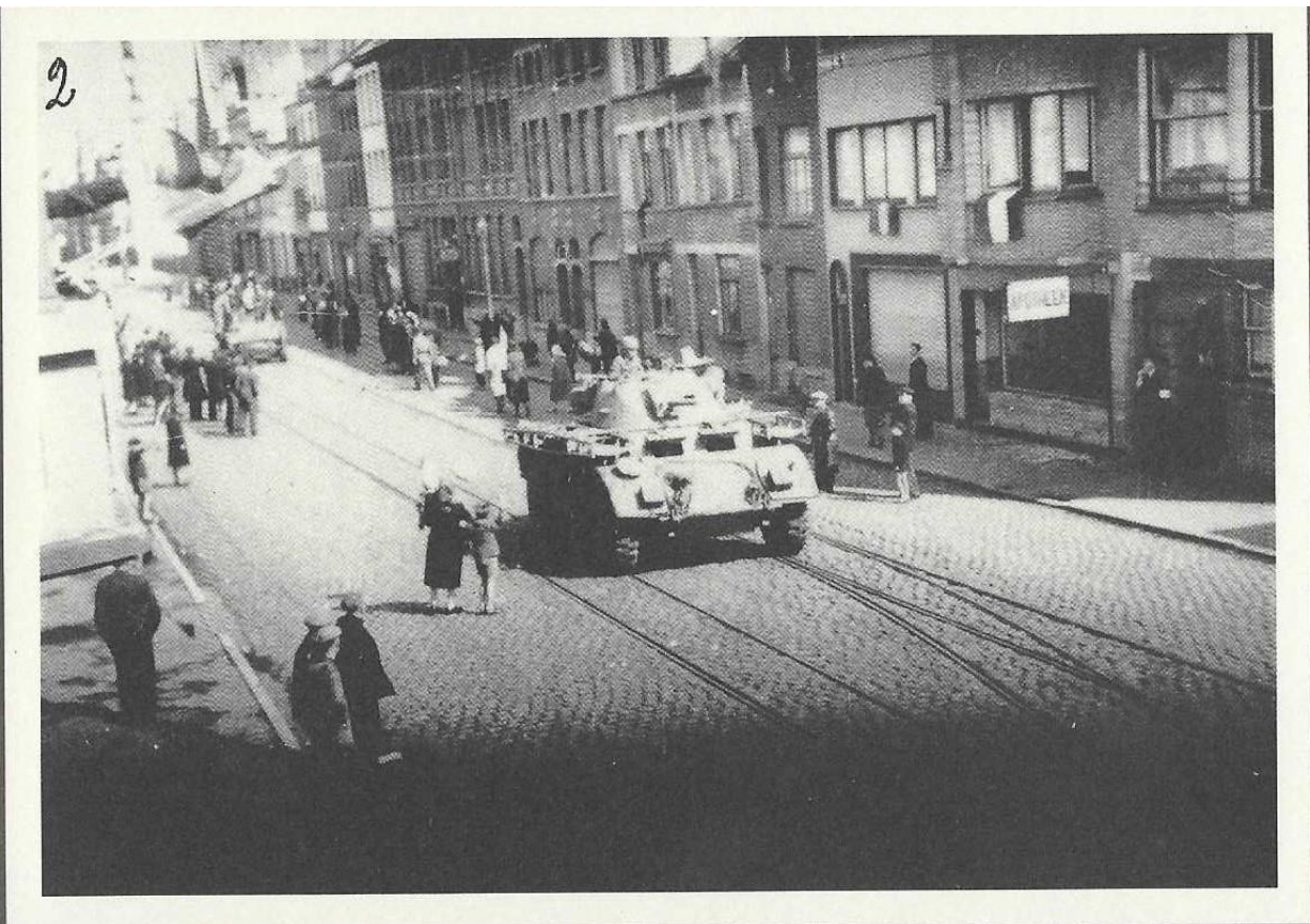
Nieuwpoortsesteenweg: eerste Canadese tanks, eerste toeschouwers en Belgische vlaggen