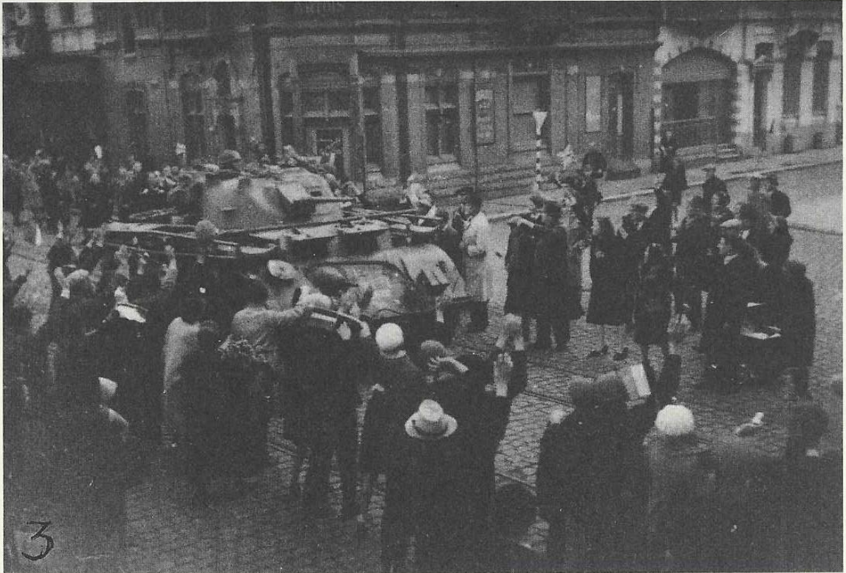
Café "Le Châtelet": Canadezen naderen Petit Paris