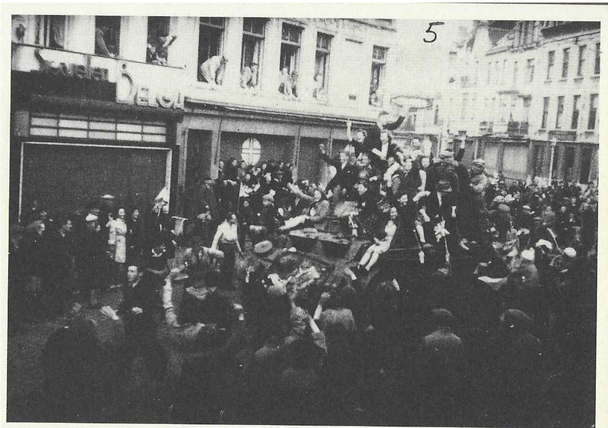
Mensenkluwen op een Canadese Pantserwagen 2016-150