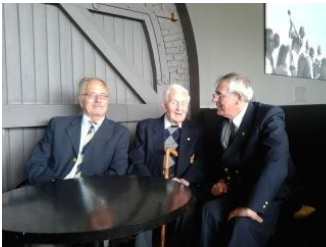
Foto genomen op 03 juni 2015 in het café van de Oostendse Golfclub

De hier afgebeelde foto mag allicht reeds nu al een historisch tijdsdocument genoemd worden. Na afloop van de jaarlijkse Paster Pype herdenking en huldebetoon op het “Oud Kerkhof” (thans Paster Pype begraafplaats), troffen wij in het ernaast gelegen café van de Golfclub een bekend drietal aan, druk verwickeld in een gezellige babbel en een ongetwijfeld interessant gesprek, want alle drie prominente figuren uit een weleer legendarische maar nu wel bijna vervlogen tijd, namelijk onze vermaarde visserijgeschiedenis, met daarin Oostende als historische spilfiguur. We konden dan ook niet nalaten, van deze toevallige “entre-nous” nog snel een foto te nemen, voor publicatie in “De Plate”. Ja, die mannen van toen, je ziet ze niet meer zo vaak bijeen, en ze worden ook - helaas in een nogal snel tempo - steeds minder talrijk. Daarom geen “selfie” maar nog vlug een “snapshot”!