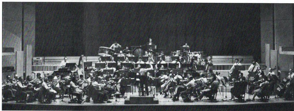
Philharmonie van Vlaanderen.