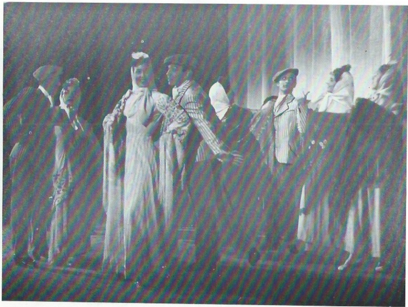
BALLETS FIESTA ESPAGNOLA