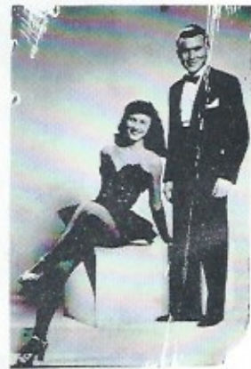
WRATO AND SISTER