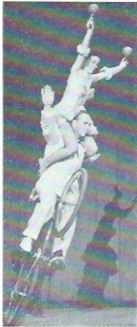
LES 2 HENKES