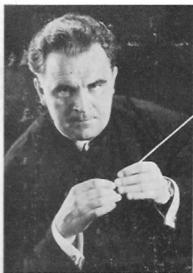
GENERALMUSIKDIREKTOR WILHELM SCHUCHTER