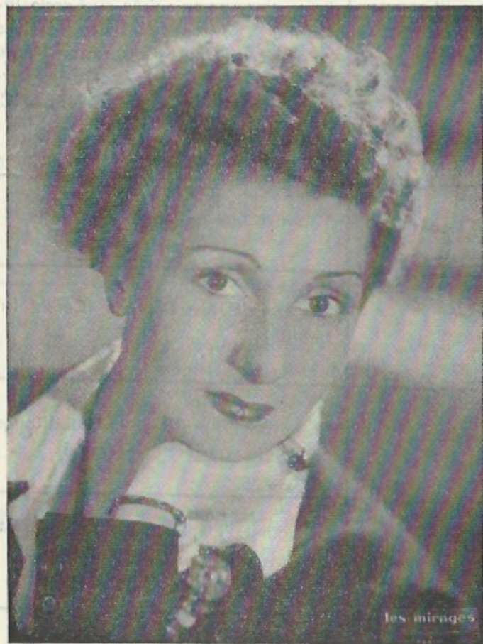
JANINE MICHEAU de l'Opéra