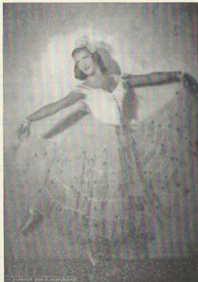
la Première Danseuse-Etoile