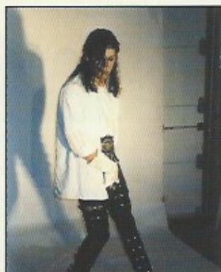
Christ'of - Megastyleshow