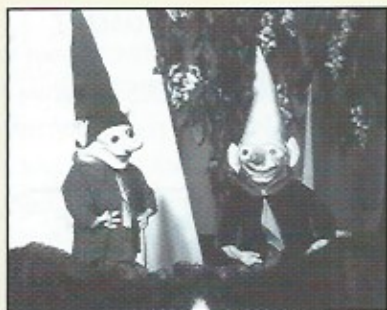
Propop "Het Vergeten Land"