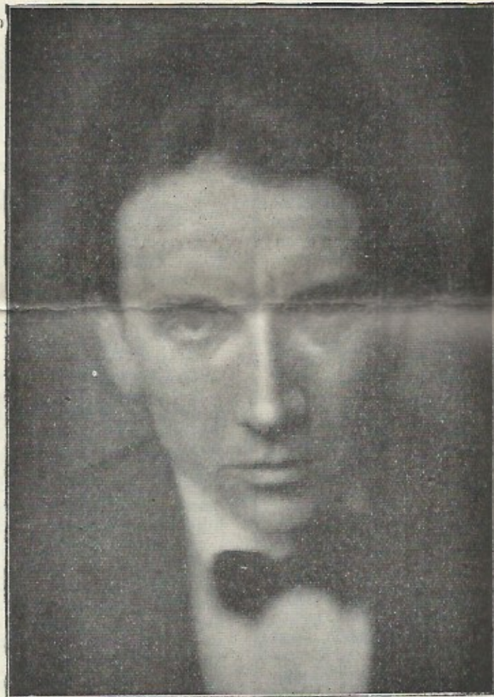
Anton VAN DE VELDE

Tot den groep Vlaamsche tooneelschrijvers die de vernieuwing zijn toegedaan behooren voornamelijk: Herman Teirlinck met: « Ik dien », « De vertraagde film », « De man zonder lijf »; Willem Putman met « De doode Rat », « Looping the loop »; Delbeke en Walschap met de « De vuurproef »; Pol de Mont met « Nuances »; Theodoor Verschaeren met « Zijn Excellentie Dansa », « Gokwaja » en last not least Anton Van de Velde met « De Zonderlinge Gast », « Christoffel », « Ste-Lutgardis », de twee « Tyl's », « Faust Junior », enz.