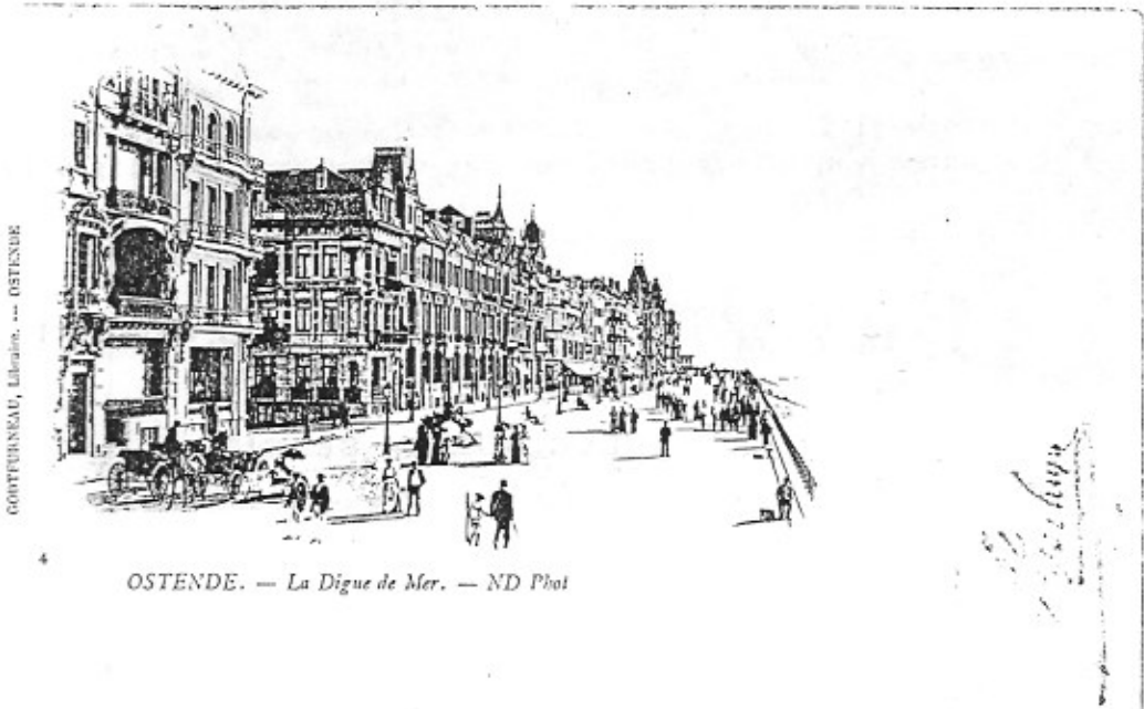
GODTFURNEAU, Libraire. — OSTENDE

Dit in de marge van de voorzijde (prentzijde).