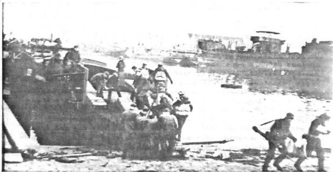
"Operatie Zeeleeuw" : inladen, uittoladen, oefeningen... maar geen invasie !

(vert.) Vandaag werd door Ib met de marineinstanties Oostende een bespreking gehouden over de inschepingsoefeningen in Oostende. Niettegenstaande de beloofde scheepsruimte blijven slechts weinige vaartuigen in Oostende. Uittoladingsoefeningen vanaf stoomschepen aan de open kust kunnen weliswaar plaats vinden, maar geen landings- en ontschepingsoefeningen vanaf binnenvaartuigen, daar sleep- en duwbotten ontbreken.