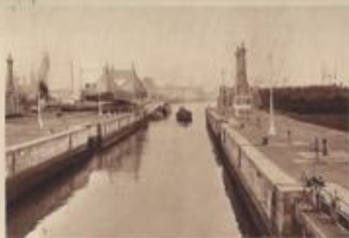
« Ecluse Dewey »

Le contraste entre la Ville balnéaire, où ne règne une animation vraiment intense que pendant la belle saison, et le quartier des pêcheurs qui travaille une débordante activité, tant en hiver qu'en été, a nécessairement frappé tous ceux qui se sont occupés de la vie et des ressources de notre population, ou ont cherché à connaître la véritable physiognomie de notre ville.