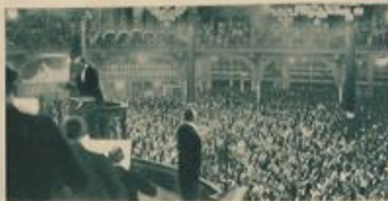
Un gala Chabagné dans la salle des concerts.

Il est inutile d'énumérer ici quelques noms, puisqu'il suffit de consulter le programme des concerts pour se rendre compte de leur importance et de leur haute portée artistique.