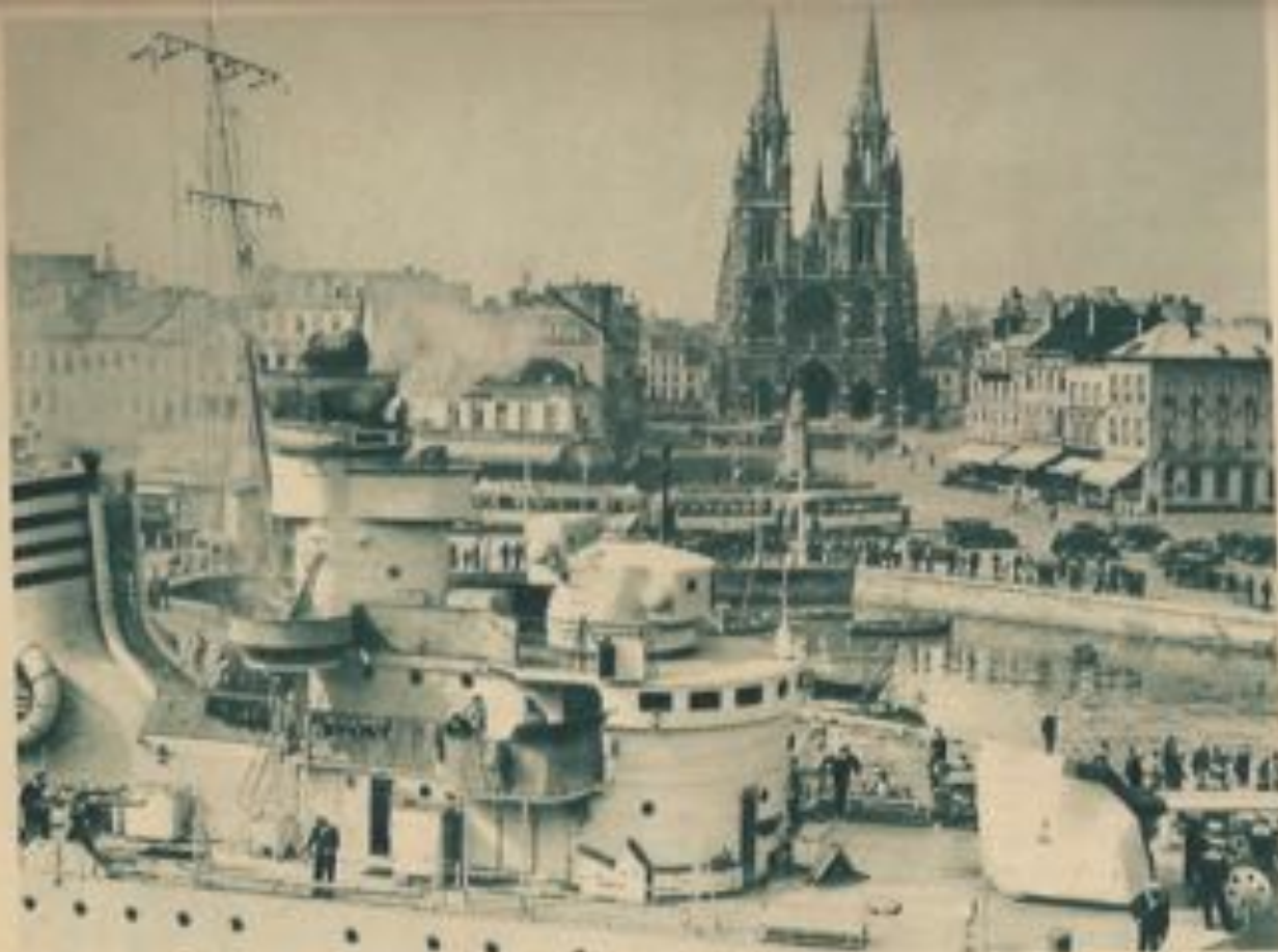
Un navire de guerre italien, visitant le port. Dans le fond l'Eglise.

au commerce du bois et du charbon et communiquent par un bassin d'évolution avec le canal vers Bruges et Gand, lequel date, comme on sait, du XVII e siècle.