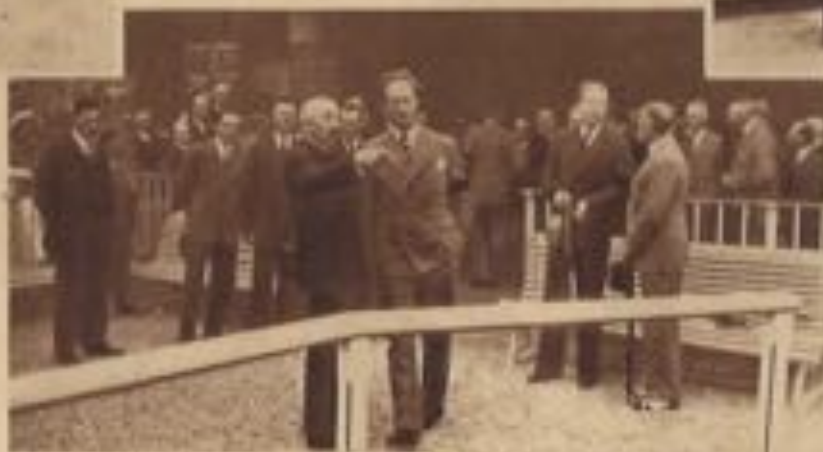
La Famille Royale à la Gare Maritime.

La dette de reconnaissance qu'à notre Ville envers nos Souverains est si grande qu'il serait vain de vouloir la délimiter en quelques lignes : qu'il nous suffise de rappeler ici que la renommée universelle de notre plage, la prospérité prodigieuse de notre station balnéaire, l'érection de nos principaux édifices comme l'Eglise primaire, le Châlet royal et les Galeries royales, la création de nos deux parcs, la construction de notre Palais des Thermes sont pour une très grande part l'œuvre de nos Rois.