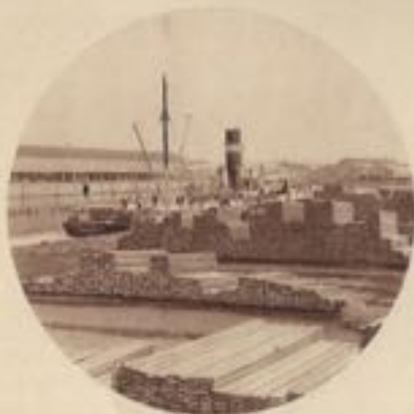
Les chantiers de bois.

Lorsqu'en 1934, M. l'Échevin Vroome proposa d'accepter la remise à la Ville par l'État des installations du nouveau port de pêche, lesquelles étaient prêtes depuis plusieurs années, mais avaient été refusées jusqu'alors par l'Administration communale, à cause des vices de construction de l'écluse donnant accès au bassin à flot, l'opposition qui avait retardé et longtemps le transfert des services de l'ancienne