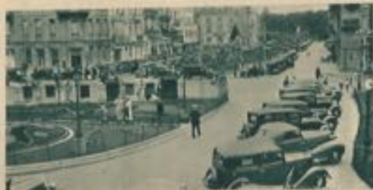
Véhicules garés devant le Kursaal

Plusieurs pavillons s'élevèrent bientôt à proximité de la plage Ouest, près de laquelle, en 1866, on bâtit les deux premiers hôtels. Lorsque le Kursaal dut être reconstruit, il fut édifié à son emplacement actuel, point extrême de la digue de l'époque