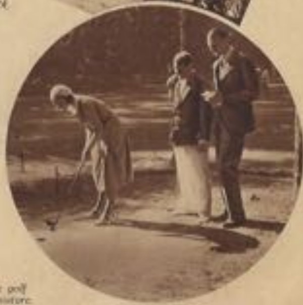
Le golf miniature.