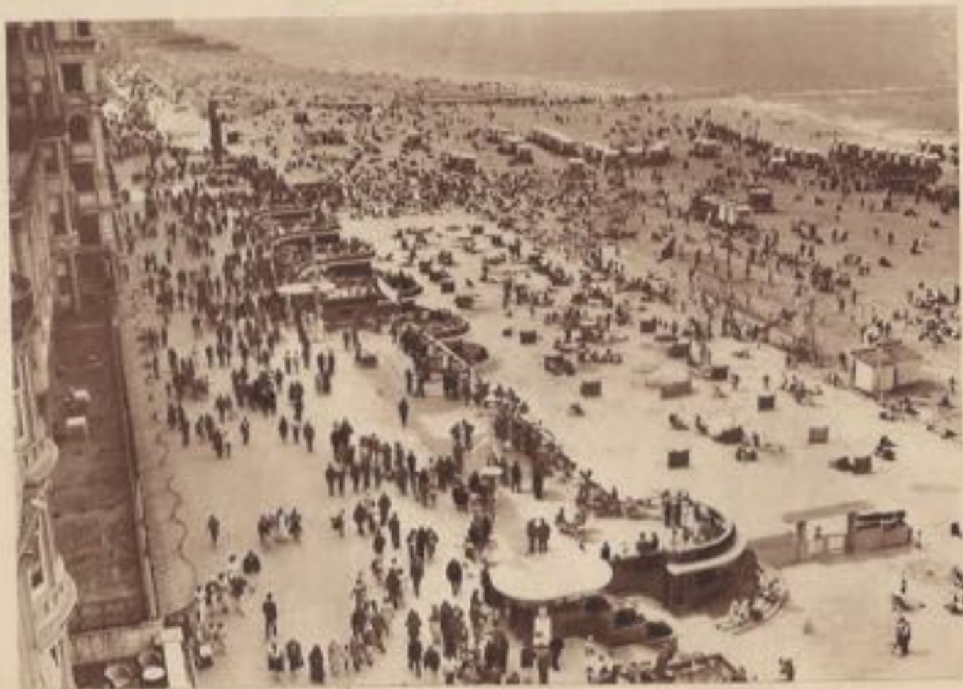
Vue d'ensemble de la plage à marée basse.