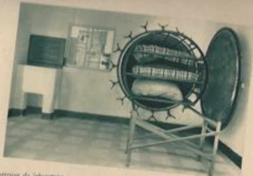
Intérieur du laboratoire