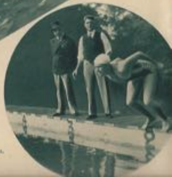
Une tentative de record en natation.