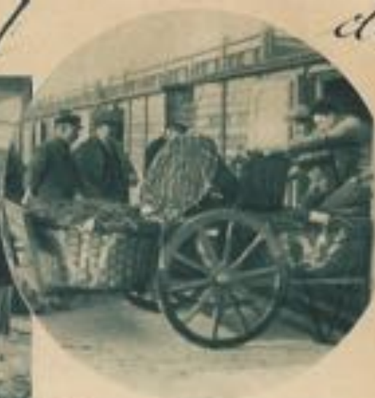
Embarquement de poisson vers l'intérieur du pays.