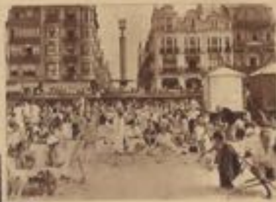
Un coin de la plage près de la digue.

ou mal en parquant les cabines, mais l'amoncellement de papiers et de déchets sous leurs roues entraînait beaucoup d'inconvénients; c'est pourquoi il fut décidé, en 1934, de construire, contre et sous la digue, des cabines fixes où les baigneurs disposeraient de pédiluves et de douches leur permettant d'achever leur toilette avec tout le confort voulu.