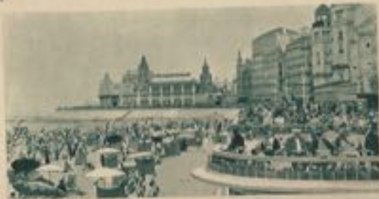
Vue sur la plage, la digue et le Kursaal