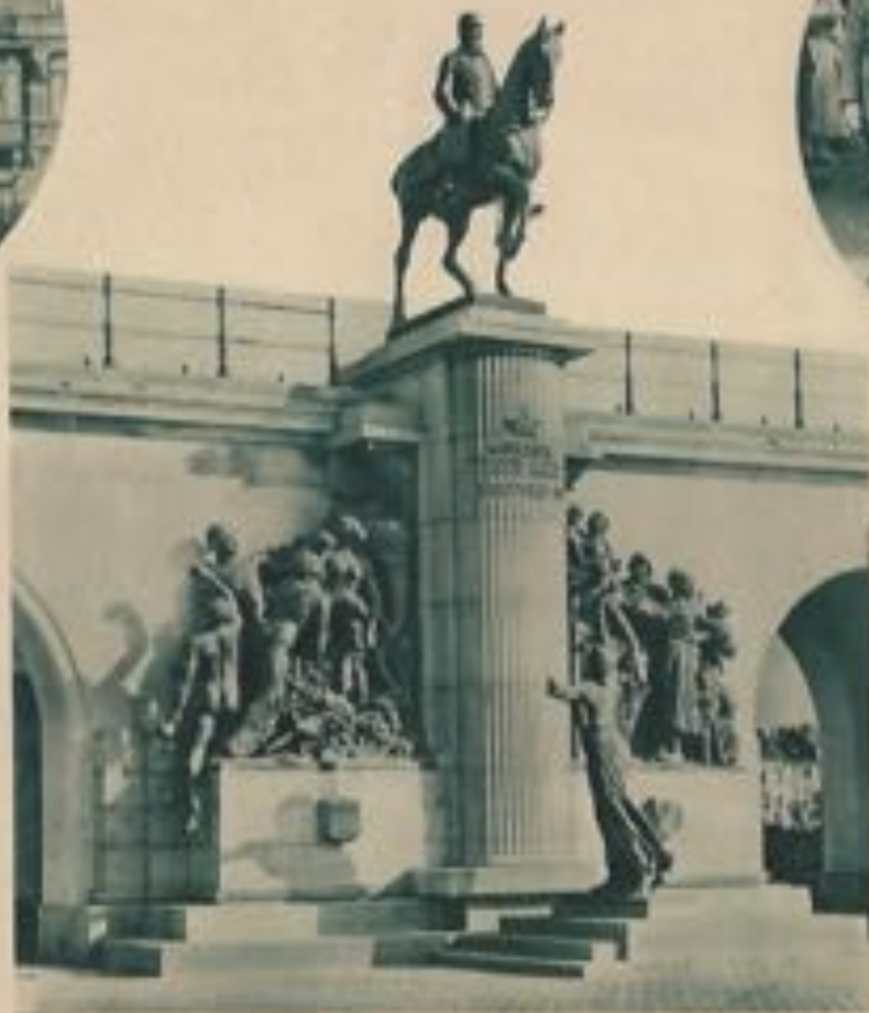
Monument de Léopold II.

Le Roi Léopold II, le plus fidèle villégiateur et le plus grand protecteur d'Ostende, qui lui doit sa transformation prodigieuse en une ville balnéaire de tout premier ordre.