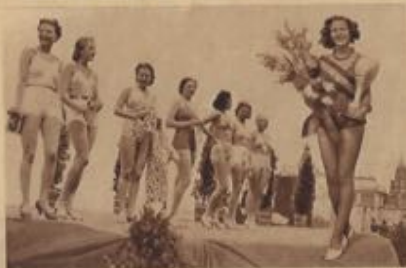
Un gracieux concours de maillots.