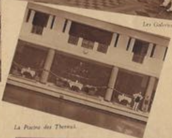
La Piscine des Thermes.