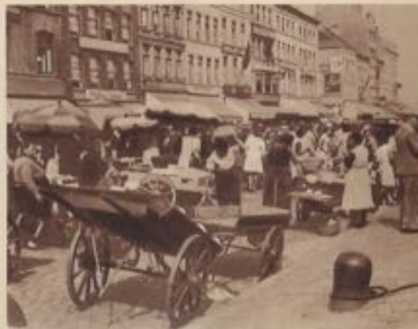
Animation au marché aux poissons

s'est jointe, plus tard, la pêche à moteur, il faudra bientôt constater l'abandon du quartier des pêcheurs, au profit de la Ville balnéaire, qui pourra ainsi s'étendre jusque là. L'ancien quai des Pêcheurs ne tendra pas, de la sorte, à devenir le quai des yachts; cette transformation permettra la création d'une belle avenue reliant la Gare Maritime à la digue de mer.