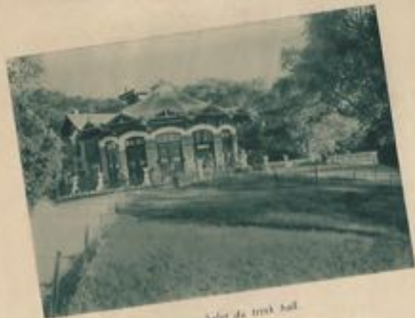
L'élegant chalet du trink hall.