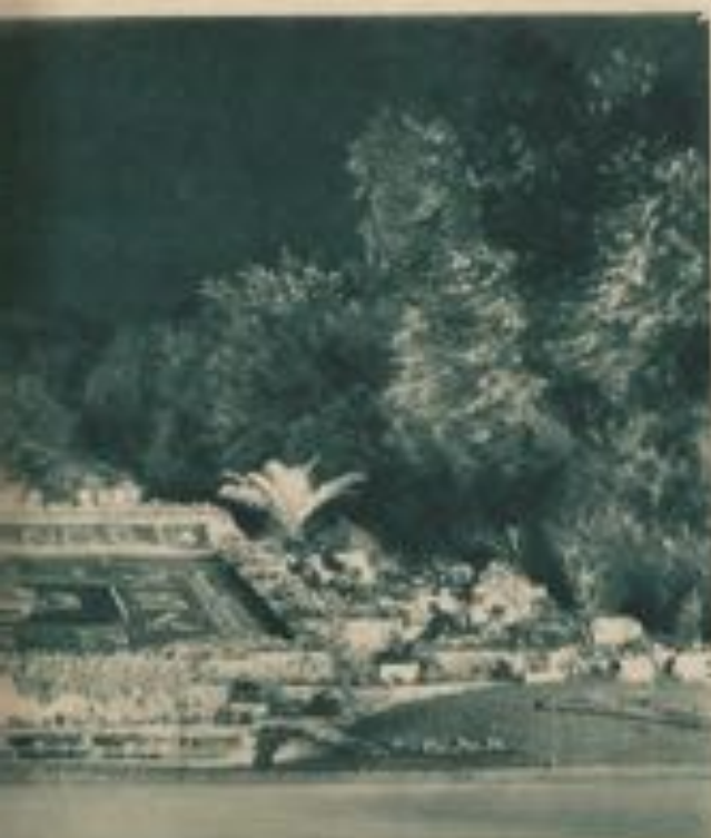
L'horloge finale impléchant sous les affectueux