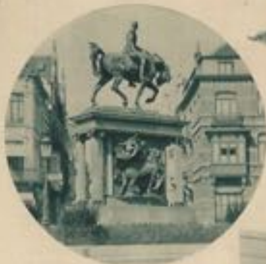
Monument de Léopold I er

Le Roi Léopold I er dont les longs et réguliers séjours à Ostende, avec la Reine Louise-Marie et ses enfants, ont contribué puissamment à la renommée de notre Plage.