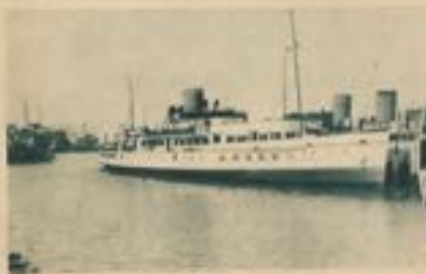
Le Royal Sovereign.