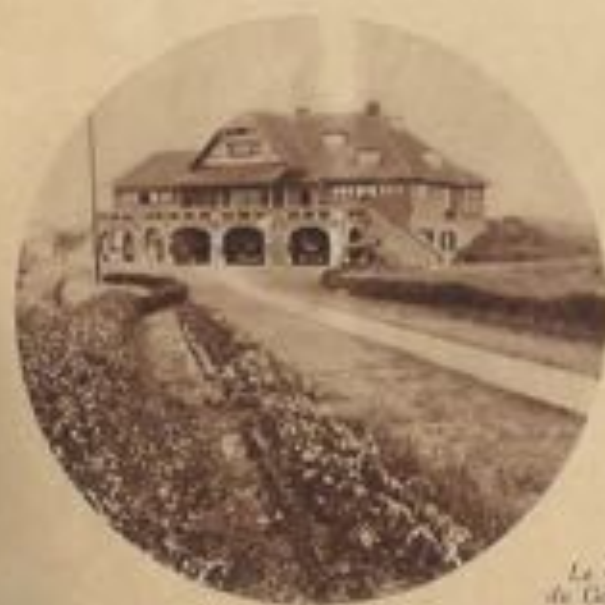
Le Club de Golf.