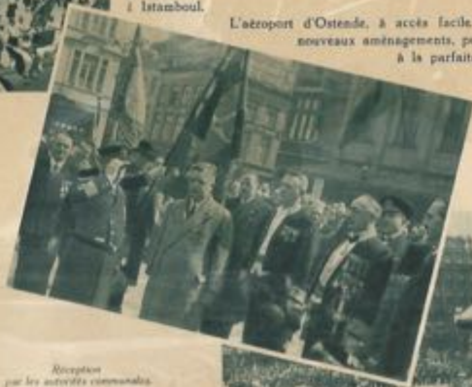
Réception par les autorités communales.