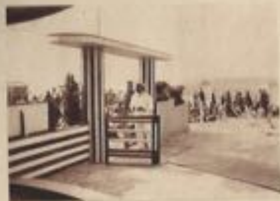
Accès des installations nouvelles.

ration résulte de l'aménagement spécial des cabines que les baigneurs occupent seulement pendant le temps nécessaire pour se déshabiller ou se revêtir, les vêtements étant, dans l'intervalle, enfermés dans une armoire réservée à chacun d'eux.