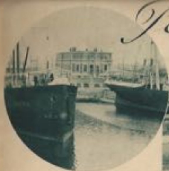
La capitainerie du port.