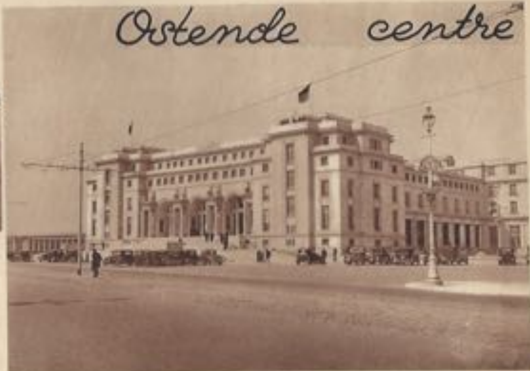
Le Palais des Thermes.