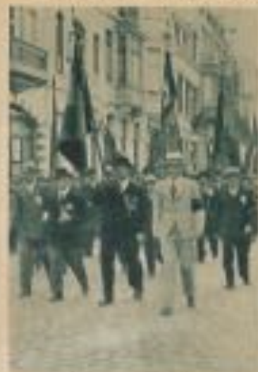
Service international de gymnastique.

L'aéroport d'Ostende, à accès facile et qui subira bientôt de nouveaux aménagements, permet, dès à présent, grâce à la parfaite organisation des services de la « Sabena », des déplacements rapides vers toutes les destinations.