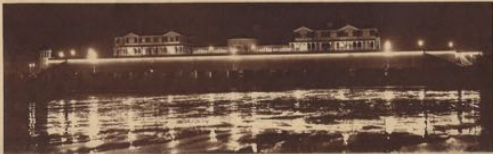
Le Châlet royal au clair de lune.

Résidence d'été de la Famille Royale, Ostende a dû fatalement être le théâtre d'événements douloureux ou réconfortants pour la dynastie : les deux faits capitaux que la Ville commémorera toujours précisent ce contraste : l'un fut un deuil national, l'autre l'heureuse naissance d'une princesse : la première Reine des Belges, Louise-Marie d'Orléans, née à Palerme, est décédée à Ostende, dans l'ancien palais de la rue Longue, le 11 octobre 1850, et la Princesse Marie-José, l'actuelle Princesse de Piémont, y est née le 4 août 1906.