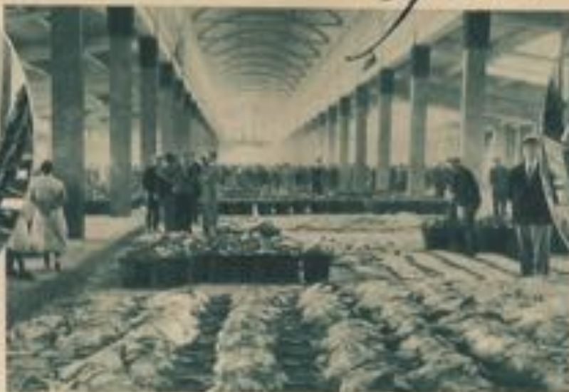
Les produits d'une belle pêche rassemblés à la minque.