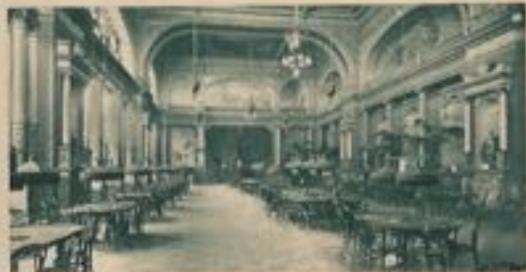
Les salons du Kursaal.