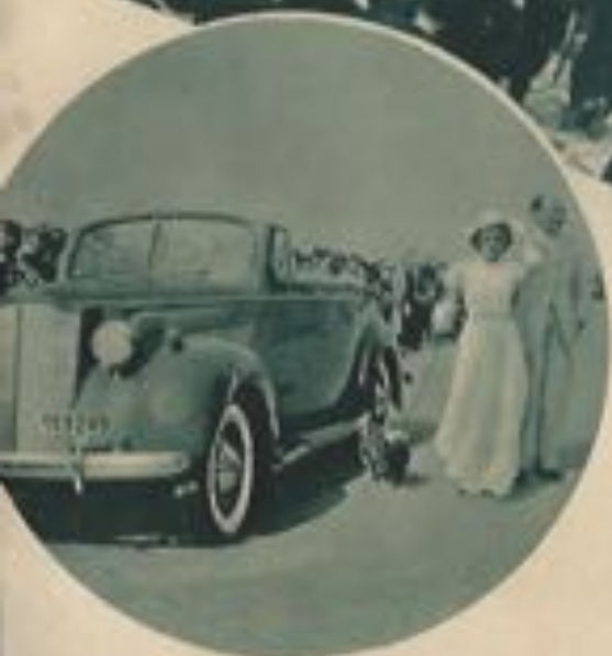
Concours d'élégance automobile.