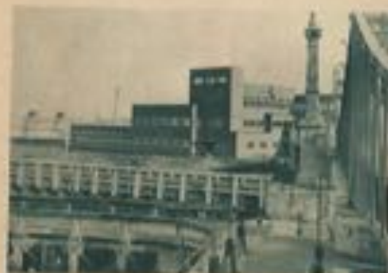
L'école de marins.