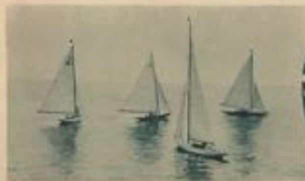
Une course de fins voiliers.