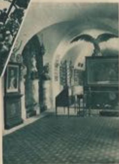
Intérieur du Musée Fort Napoléon.