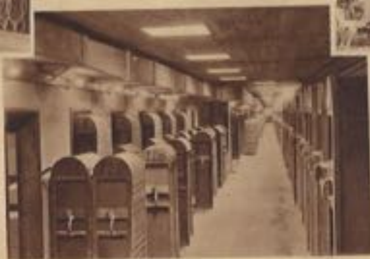
Intérieur des installations.