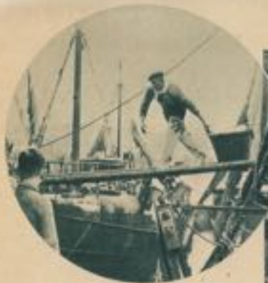
Déchargement des bateaux de pêche.