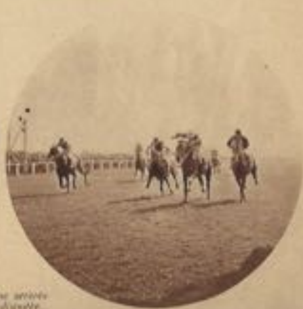
Une séance des équilibres.