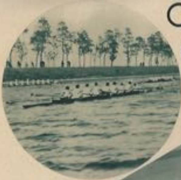
Régates à Ostende.