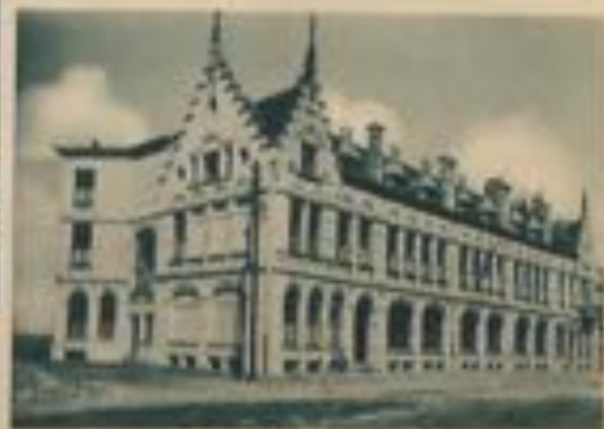
L'école de pêche à Ibis.