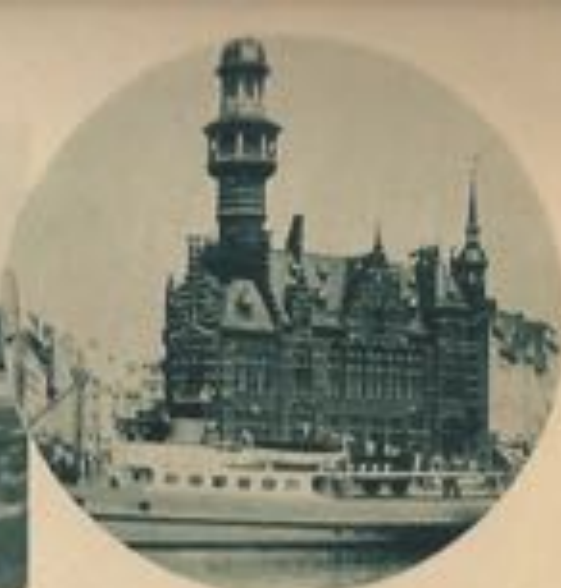
Le bâtiment du pilotage.