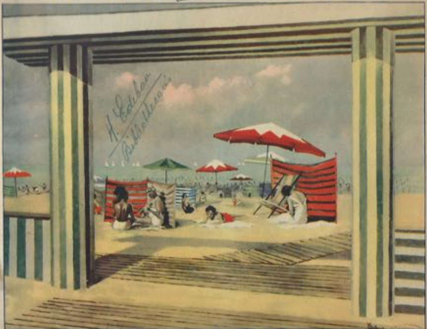
Portique du Solarium