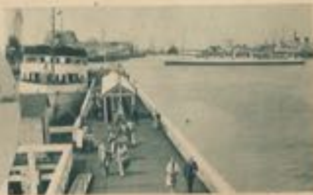
Arrivée des bateaux anglais « Queen of the Channel » et « Royal Sovereign ».