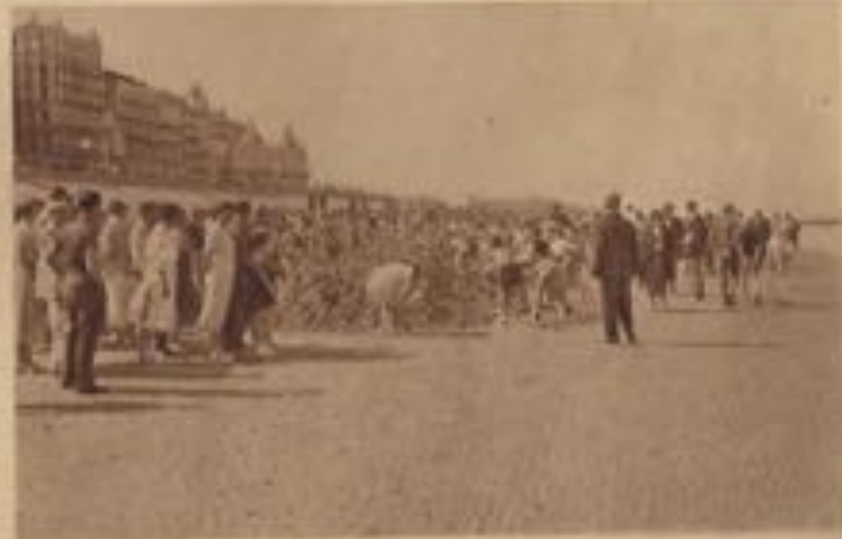
Jeux d'enfants à la plage.