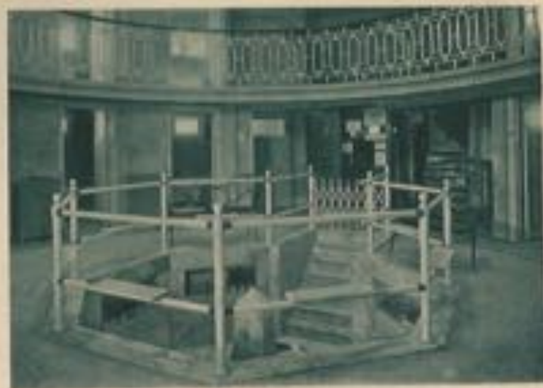
La Fontaine intérieure du trink hall.