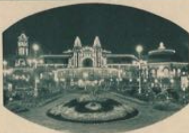
Le Kursaal la nuit.

Les transformations que le Kursaal a subies durant les années de 1900 à 1907 en ont fait un véritable palais, dont l'architecture complexe ne correspond sans doute plus entièrement aux exi-