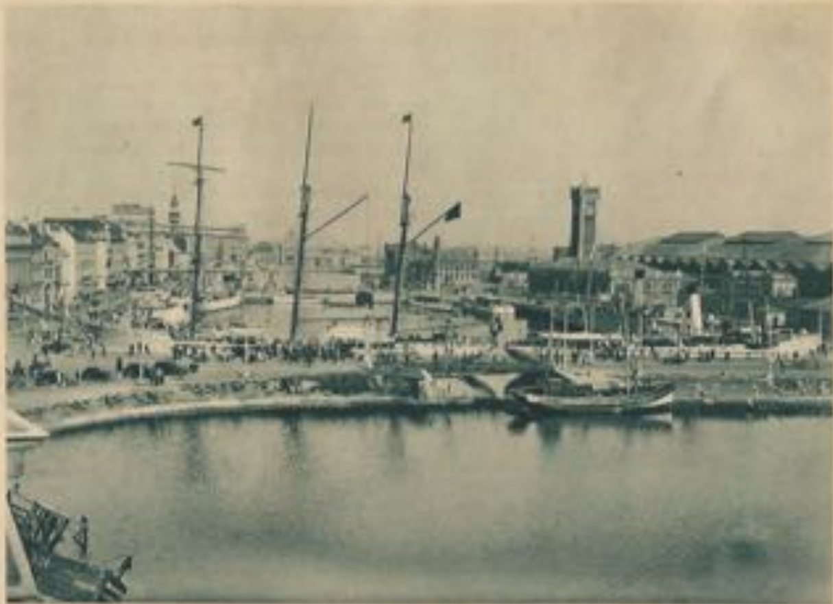
Le « Mercator », navire école belge, dans les bassins.

Les trois bassins qu'on voit devant les stations des chemins de fer datent d'un siècle plus tôt, du règne de Marie-Thérèse et de Joseph II. Ils furent utilisés par les navires de commerce jusqu'en 1905, quand furent ouverts à la navigation les grands bassins à flot, plus au Sud. Ceux-ci servent principalement