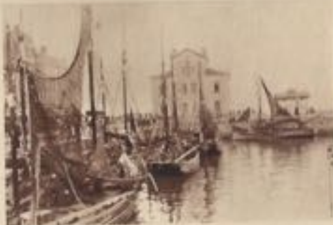
Le Quai des Pêcheurs.