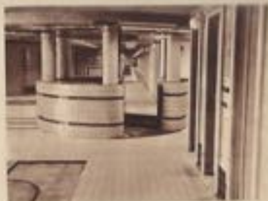
Vue intérieure des cabines pour dames.

Le renouvellement des installations balnéaires, dû à la Société « Ostende-Plage » et achevé pour la saison de 1935, a été une initiative particulièrement heureuse, qui a mis définitivement un terme aux critiques amères dont la Reine des Plages avait jusqu'alors été l'objet.