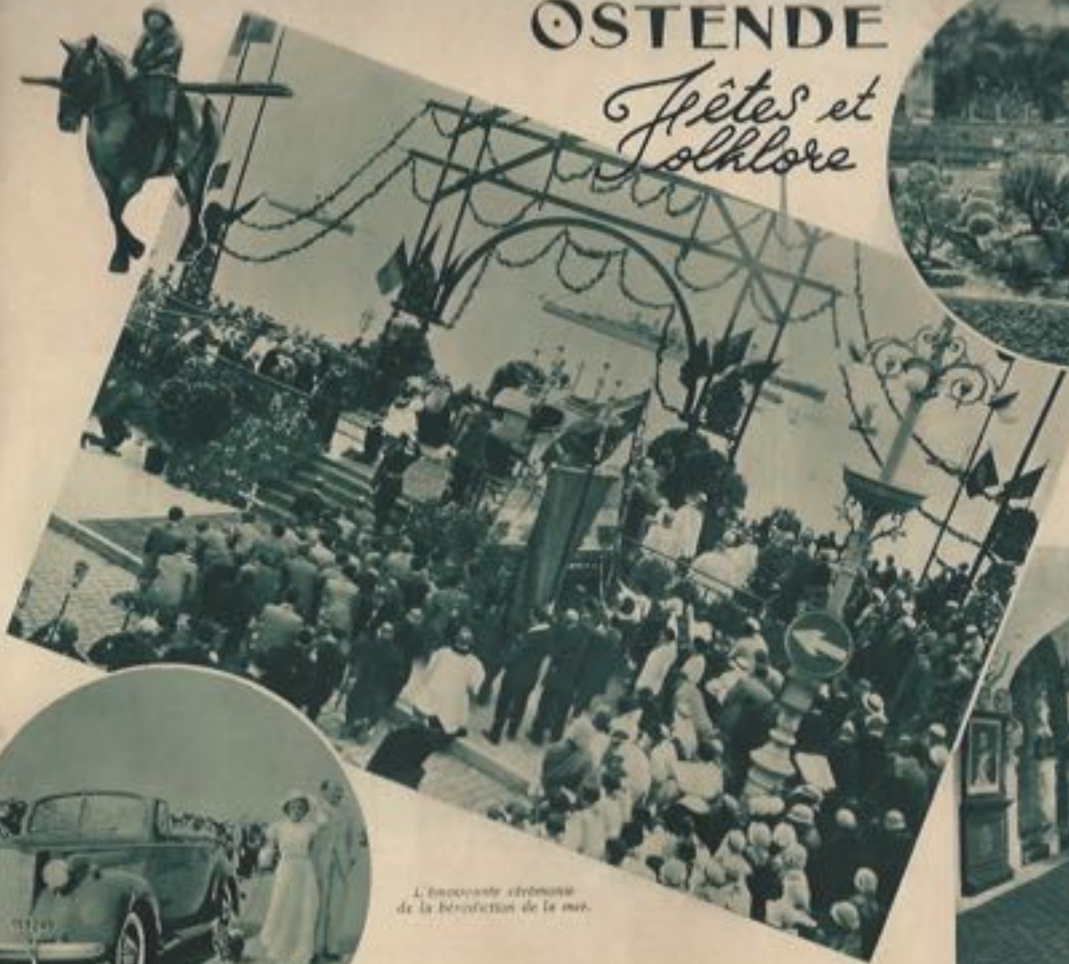
L'importante cérémonie de la Bénédiction de la mer.