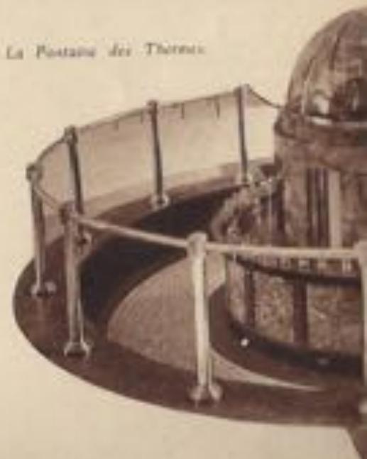
La Piscine des Thermes.

Au lieu de la saison balnéaire proprement dite,