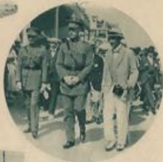
Le Roi Albert aux courses d'Ostende.

Le Roi Albert I er , dont la sollicitude pour les pêcheurs s'est manifestée en toute occasion et particulièrement par la fondation de l'Œuvre de l'Ébis, pour les orphelins de pêcheurs et, à la fin de son règne, par l'auguste appui qu'il accorde aux promoteurs du vaste projet dont l'heureuse réalisation nous vaut aujourd'hui l'existence, à l'Est de la ville balnéaire proprement dite, du plus important port de pêche.