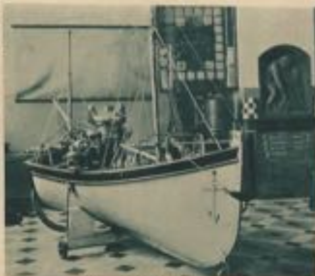
L'Œuvre de l'Ibis (intérieur).