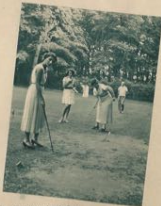
Le golf-minature dans le Parc

Quand ce palais fut enfin construit en 1930, l'Administration Communale fit forer, dans les jardins de l'établissement, un nouveau puits artésien à l'usage de cet institut. Le puits atteignait en juin 1931 la profondeur de 350 m.; les eaux artésiennes qui en proviennent sont débitées Promenade Albert I er , buvette du Palais des Thermes.