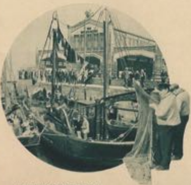
Les bateaux de pêche amarrés devant la minque.

Cette proposition reçut l'agrément du Roi Léopold II et, plus tard, l'appui du Roi Albert I er ; elle n'a pourtant reçu de suite qu'après la guerre, en 1922; la construction de la nouvelle minque fut entamée en 1929. Certains vices de construction aux écluses et aux slipways retardèrent ensuite, jusqu'en septembre 1934, la mise en exploitation de ces installations; celles-ci ont été complétées depuis par l'agrandissement du bassin à flot pour chalutiers, la reconstruction des écluses et des slipways défectueux.