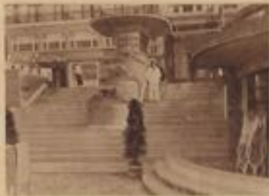
Les nouvelles installations de la plage.

Les cabines roulantes qui, depuis plus d'un siècle, avaient suffi pour transporter les baigneurs jusqu'au bord de l'eau et pour les ramener plus tard sur le sable sec, étaient devenues, vers 1930, si nombreuses, qu'un continuel encombrement en résultait et que sur la plage, jadis bien trop vaste, il n'y avait plus assez de place pour les jeux des enfants.