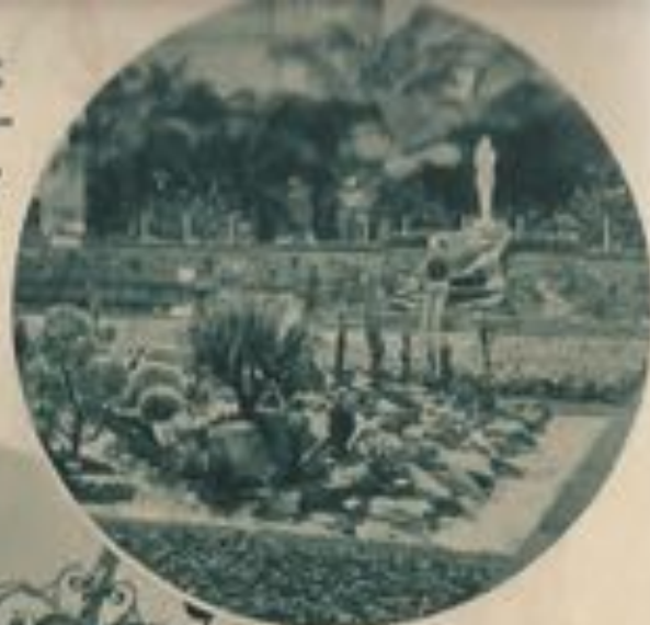
Les robes florissantes.