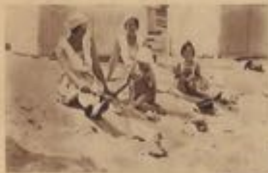
La Reine Astrid et les Princes à la plage.

La dette de reconnaissance qu'à notre Ville envers nos Souverains est si grande qu'il serait vain de vouloir la délimiter en quelques lignes : qu'il nous suffise de rappeler ici que la renommée universelle de notre plage, la prospérité prodigieuse de notre station balnéaire, l'érection de nos principaux édifices comme l'Eglise primaire, le Châlet royal et les Galeries royales, la création de nos deux parcs, la construction de notre Palais des Thermes sont pour une très grande part l'œuvre de nos Rois.