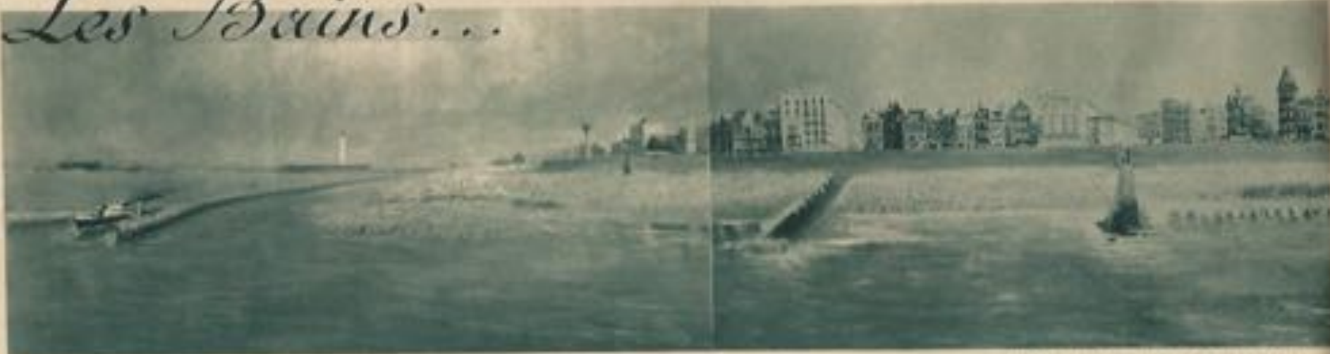
« Vue panoramique de la digue de mer ».