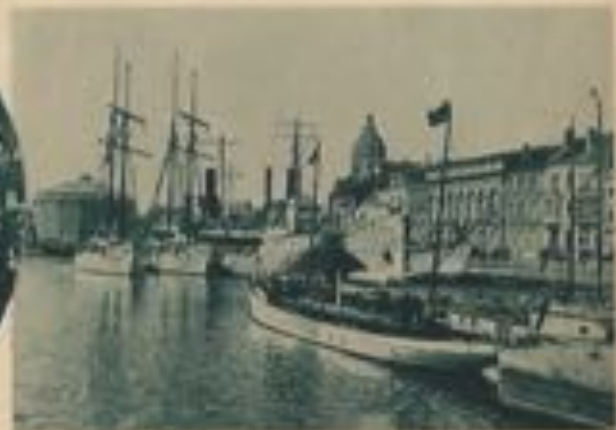
Quelques yachts étrangers.