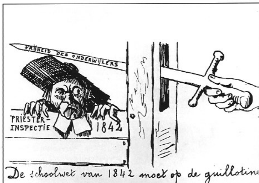
De wet van 1842 geeft aan de priesters te veel macht en moet verdwijnen. Liberale spotprent.