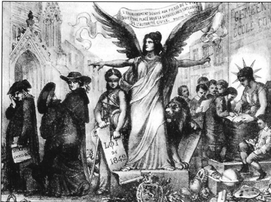
De wet van 1879 maakte een einde aan het regime van de wet van 1842. De geestelijkheid had niet langer invloed op het gemeentelijk onderwijs. Volgens de liberale visie zegevierde de vrijheid. Bron: Twintig eeuwen Vlaanderen , deel III, p. 324.