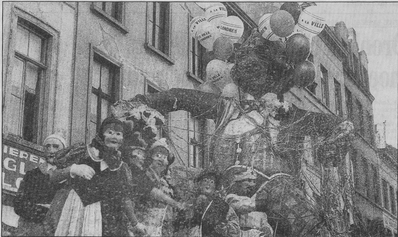
De wagen van Prins Carnaval (1937). De kaart is een publiciteitskaart die in 1938 verstuurd werd om het gemaskerd bal van de „Rat Mort” en de grote karnavalstoet, die met talrijke wagens en gemaskerde groepen de stad zouden doorkruisen, aan te kondigen.