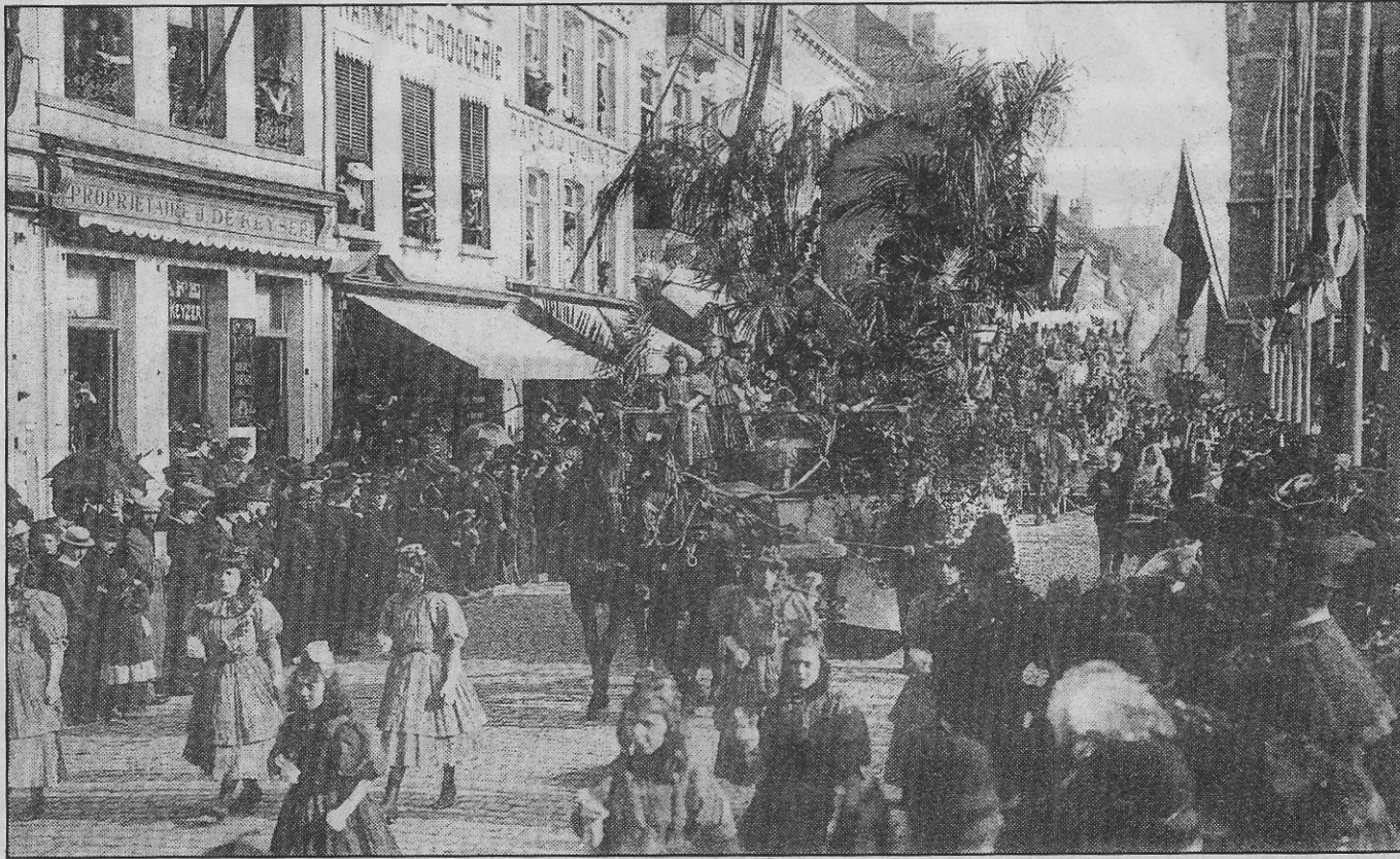
De grote verklede stoet van Marquet die 2 dagen uitging. Men ziet in de Louisastraat de praalwagen van de vereniging „nu voor later” die de vier seizoenen uitbeeldt. (1907)

Nu er dit jaar geen carnavalstoet komt, spreekt iedereen over de carnavalstoeten van vroegere jaren. Oostende heeft steeds een traditie gehad van stille, mooie stoeten, die weliswaar niet echt karnavalachtig aandeden, maar meer een kijkstuk waren uit onze lokale folklore.