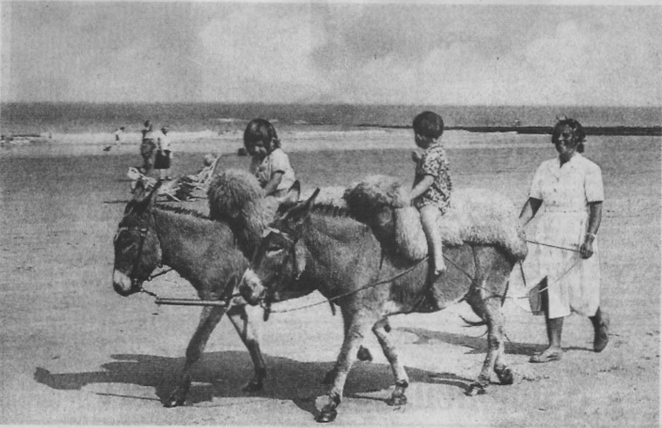
Nog één van onze laatste verhuursters van ezeltjes op het strand. Let op het schaapsvel dat men op de rug van de ezeltjes aanbracht om de benen van de jonge ruitertjes te beschermen. (Circa 1950)