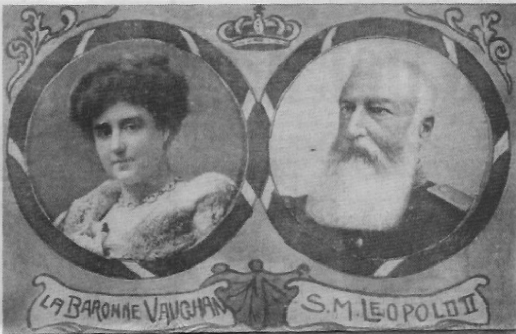
Een gedurfde prentkaart die de Barones de Vaughan samen met Leopold II voorstelt.

Hij huurde voor Blanche een villa in de Parijsstraat, van waar een ondergrondse tunnel naar de conciergerie in het Koninklijk Chalet liep. Deze onderaardse gang is echter al lang verdwenen.