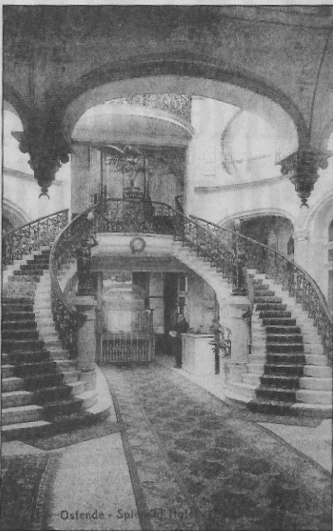
Ostende • Splendid Hôtel