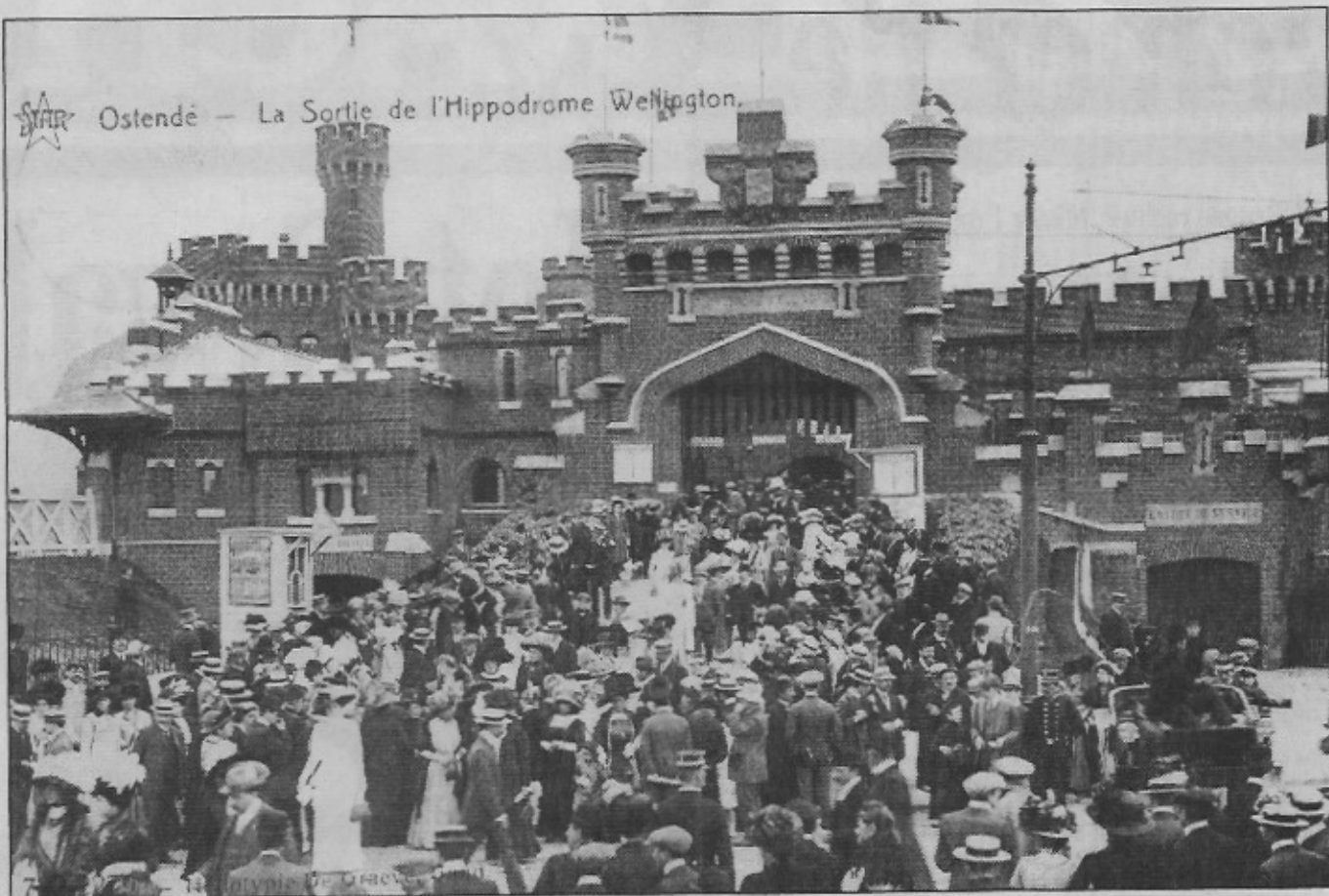
De ingang van de Wellington-renbaan via het oude Wellington-fort. (Circa 1908)