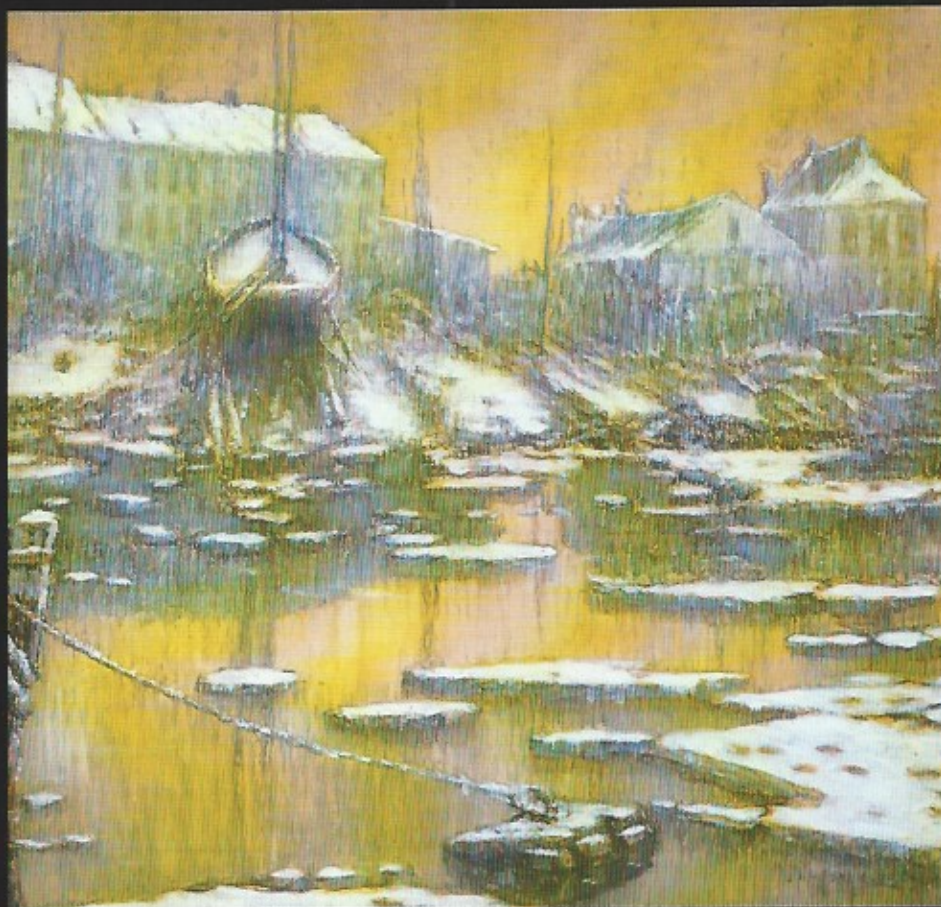
Werf onder de sneeuw (1910); aquapastel op papier.

In de periode die de Eerste Wereldoorlog voorafging (la belle époque) hield Jan De Clerck regelmatig zomerse één-