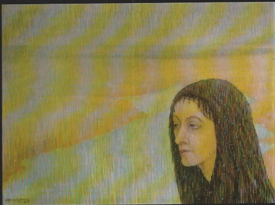
Aanvende Vissersvrouw, 1918. Olie op doek.