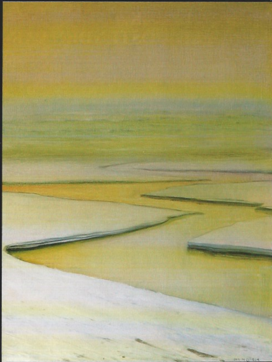
Decemberdag. Olie op doek. 1918.

manstentoonstellingen in de grote Oostendse hotels, terwijl hij, zij het zelden, ook doeken instuurde naar enkele groepsalons te Oostende, Namur, Wenen en Nieuwpoort.