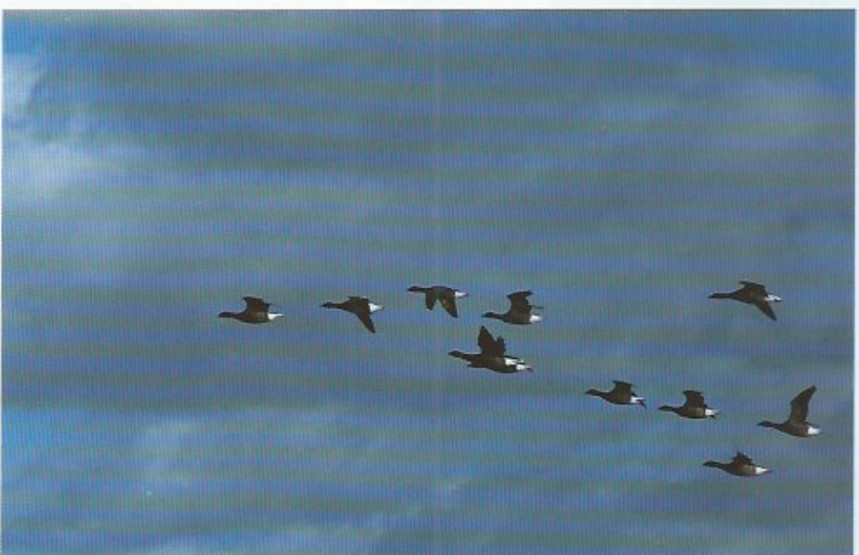
Voorbijtrekkende rotganzen, vogels uit Noordwest-Siberië. Zij kondigen het begin van de winter aan.