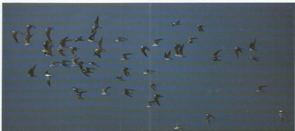
Deze zwarte sterntjes hebben nog een lange weg voor de boeg, ze overwinteren immers in tropisch Afrika.

Oktober is ook de maand van de eerste hevige herfststormen die dan weer typische zeevogels zoals jan van genten, grote jagers, zeekoeten, grote zeeëenden enz... naar onze kust doen afdrijven zodat ze waarneembaar worden voor de vogelwaarnemers bij ons. Van veel van die soorten (van allemaal wellicht) maakte amateur-fotograaf Roland François mooie opnames. Erg impressionant zijn