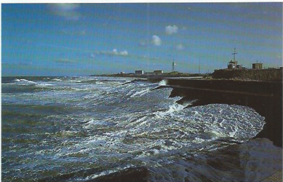
Een stormachtige noordwester; ideaal voor het observeren van zeevogels.