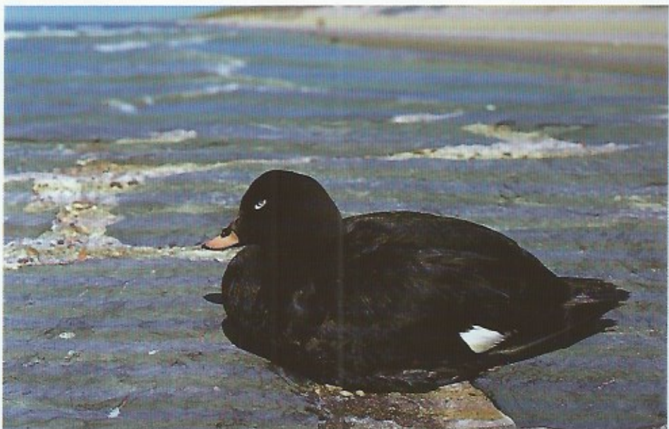
Een stervende grote zee-eend op het strand te Bredene. De vogel is vergiftigd door stookolie.