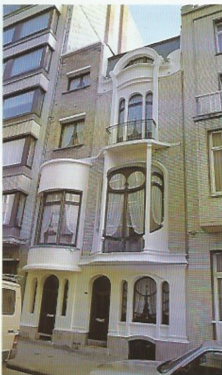
Twee gevels in Art Nouveaustijl. Links op de foto het pand in de Van Iseghemlaan nummer 12, rechts het bekende geveltje in de Vlaanderenstraat nummer 17.

Een meer dan opmerkelijk geveltje is dit in de Vlaanderenstraat nr 17. Het is een pareltje van bouwkundig erfgoed in Oostende. Het pand werd gebouwd in de jaren dertig, door architect Theobald van Hille die zich bijzonder creatief toon-