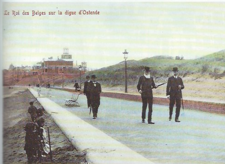
Hier Leopold II op de zeedijk omstreeks 1900. De Koninklijke Galerijen waren nog niet gebouwd zoals duidelijk blijkt uit deze prentkaart.