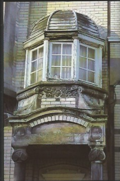
Twee details uit de boven afgedrukte gevels van deze voor Oostende zo karakteristieke villa's. Het is het bouwkundig erfgoed van Oostende maar wie hecht daar enige waarde aan? Gebrek aan interesse leidt tot slecht beleid.

ontrokken werd door een gedeelte te verkavelen voor de bouw van particuliere villa's. Van kortzichtigheid gesproken. CW.