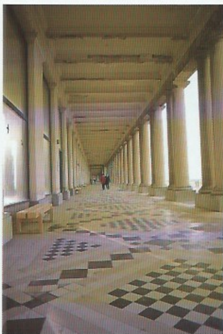
De unieke wandelgalerij tussen de Koninginnelaan en de Wellington Hippodroom werd gebouwd tussen 1904 en 1906.

Het gebouw is L-vormig. Het westelijk uiteinde op de zeedijk bevat een sierlijk, gekroond'torentje. De grote rondbogen vensters zijn van elkaar gescheiden door sierlijke ruiten.