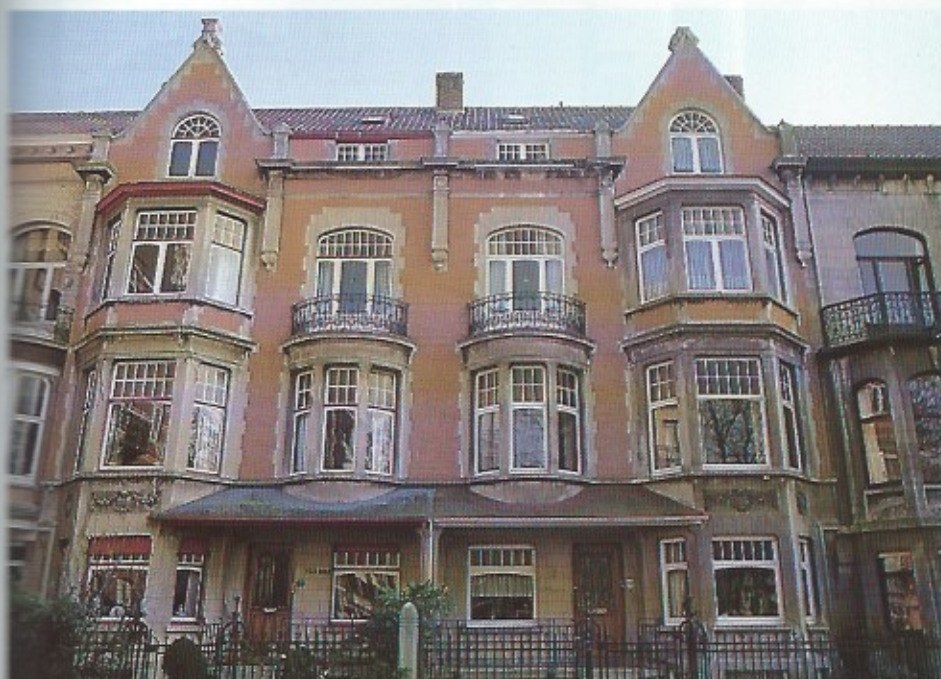
Deze beide huizen aan het Prinses Clementinaplein vormen een prachtig geheel. Het is een soort woningen dat mede bepaald door de aanwezigheid van groenvoorziening zeer in de markt ligt.

Tussen deze « Venetiaanse Galerijen » en het ruitersstandbeeld van Leopold II bevindt zich op een oude duinheuvel de nieuwe Koninklijke Villa (nu restaurant), die door middel van een recent gebouwde galerij van de zeedijk wordt afgescheiden.