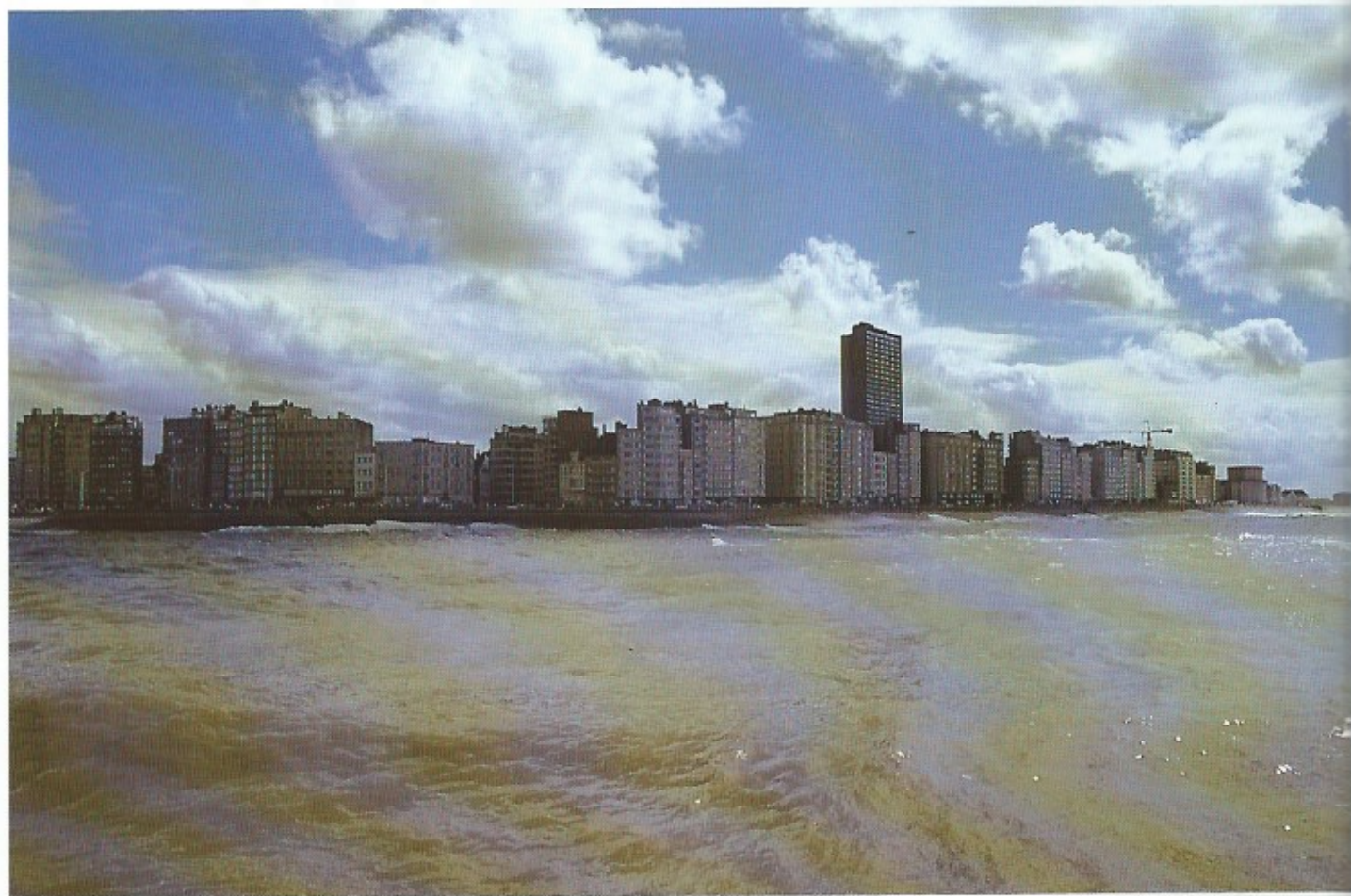
Op de vroegere stadswallen werd de eens zo beroemde zeedijk van Oostende aangelegd.

Na een eerste bijdrage onder deze titel in onze vorige uitgave, waren de reacties hierop zo groot, dat we besloten nogmaals op dit thema terug te komen. Het bouwkundig erfgoed van de badstad Oostende blijkt immers zeer veel mensen te boeien.