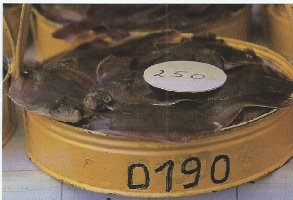
Zowel in Nieuwpoort, Oostende als Zeebrugge kan men 's morgens levend vers aangevoerde vis kopen, zoals schol, tong, wijting, enz...

De meest recente haven aan onze kust is Zeebrugge. Zeebrugge bezit geen visserijtraditie. Maar is wel de meest bloeiende haven van onze kust. Haar ontstaan als havenplaats dankt Zeebrugge aan het plan van Leopold II om de stad Brugge weer in verbinding te brengen met de zee. Zo ontstond Zeebrugge. De werken voor