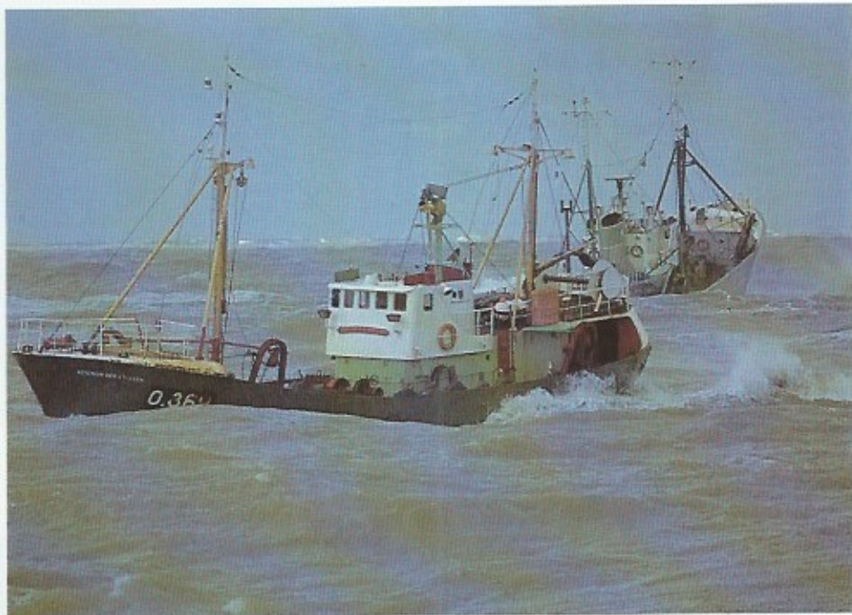
Stormweer op de Noordzee. De O.369 Koningin der Engelen haast zich de haven van Oostende binnen. Ondanks het slechte weer vaart een andere treiler uit ter visserij.

Naast het toerisme, maar veel ouder (even oud als de prilste kustbewoning) is visserij onze meest typische kusteconomie. Zo was er een tijd waarin iedere nederzetting aan zee een eigen vissersvloot bezat. En ook vanaf het strand zelf werd er met netten intens gevestigd. Zo hebben Adinkerke, Blankenberge, Blutsie, De Panne, Heist, Knokke, Koksijde, Lissewege, Lombardsijde, Mariakerke, Middelerke, Nieuwpoort, Oostduinkerke, Oostende, Walraversijde (Raversijde) Wenduine en zelfs Brugge en Damme hun eigen visserij gekend. Brugge en Damme waren toen in verbinding met de zee via de Zwinmond. Een haven was toen nog geen essentie om de visserij te beoefenen. Het harde labeuren om de grote houten sloepen met man en macht op het strand te trekken bleef overigens in Heist, Blankenberge, Adinkerke-De