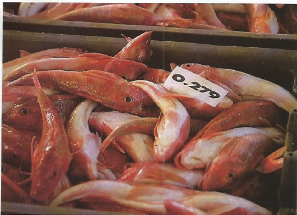
Vers aangevoerde rode poot. Een lekkere maar bij de consument te weinig bekende vissoort.

Als volwaardige havenstad dateert Oostende van 1446. Gedurende vele eeuwen kende de visserij in Oostende een steeds toenemende groei. Reeds in de