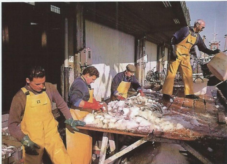
Het lossen van de vis gebeurt door vislossers die de vis sorteren naar soort en grootte.

Panne bestaan tot tegen het eind van de 19de eeuw. Uiteindelijk bleek het comfort van een haven met aanlegsteigers en losplaatsen een must. Ook de vishandel zelf raakte steeds meer georganiseerd en concentreerde zich op de plaatsen waar de grootste hoeveelheden vis werden aangevoerd.