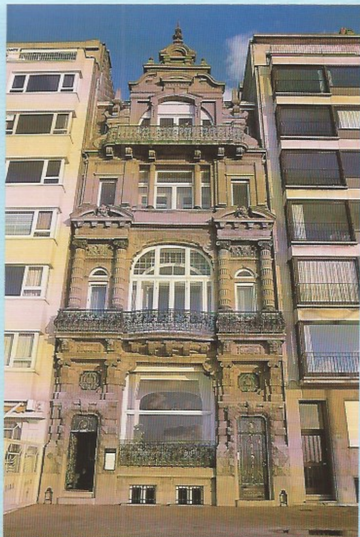
De villa Maritza, een mooi voorbeeld van de belle époque-villa's die omstreeks de eeuwwisseling op de zeedijk werden gebouwd.

geschenk uit de glorie van Oostende. Het is tevens een prachtvoorbeeld van 19de eeuwse vakmanschap. De unieke combinatie van artisanale natuursteen-techniek met smeedwerk in gietijzer hebben wonderwel de tand des tijds (het zee-klimaat) doorstaan. Ook qua architectuur, gaande van neo Italiaanse renaissance tot neo barok en art nouveau blijft de Villa Maritza een parel van belle époque kustarchitectuur. In dat laatste verband willen we evenwel ook verwijzen naar de panden gelegen in het zelfde zeedijkgedeelte nummers 83, 84 en 88. Van deze drie laatste villa's is de architect ons bekend.