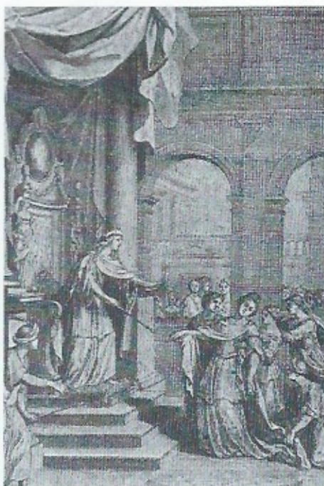
Gravure van een schoonheidswedstrijd in vroegere tijden.

(haar verkiezing veroorzaakte bovendien een hele rel en nergens slaagden we erin