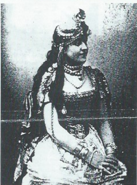
Bij de eerste miss-verkiezing in 1888 in Spa vond men dit het mooiste meisje!

nog familie van haar terug te vinden). Vooral vanaf de eeuwwisseling kwam er evenwel veel kritiek op dergelijke schoonheidswedstrijden. Sommige staken hun afkeer voor dergelijk vertoon niet onder stoelen of banken en noemen het zelfs een; «wansmakelijke vernedering van de vrouw». Dit protest kon echter het enthousiasme voor de schoonheidswedstrijden en miss-verkiezingen niet stuk maken.