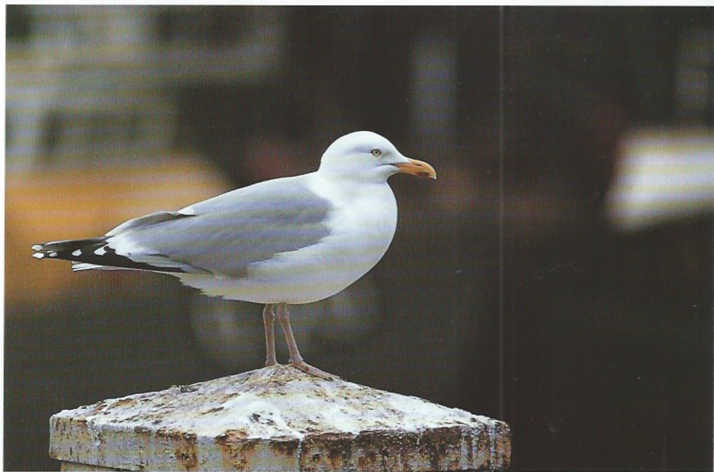
Dit is de zilvermeeuw. Het is een zeer algemeen voorkomende meeuw langsheen onze kust. Iedere kustbewoner en toerist kan deze vogels observeren langs het strand of vanaf de zeedijk.