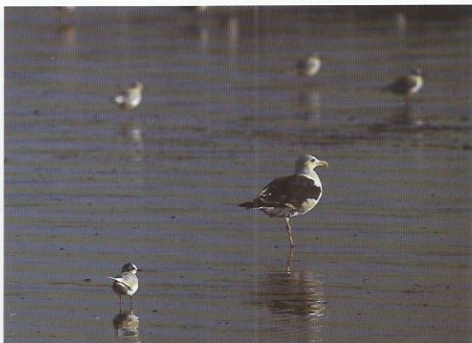
De grootste en de kleinste meeuw. Op de voorgrond het dwergmeeuwtje, achteraan de grote mantelmeeuw op het strand te Oostende.