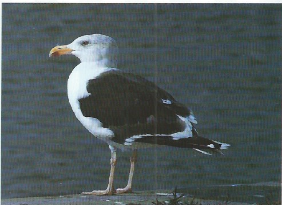
De grote mantelmeeuw is de grootste aan onze kust voorkomende meeuwensoort.