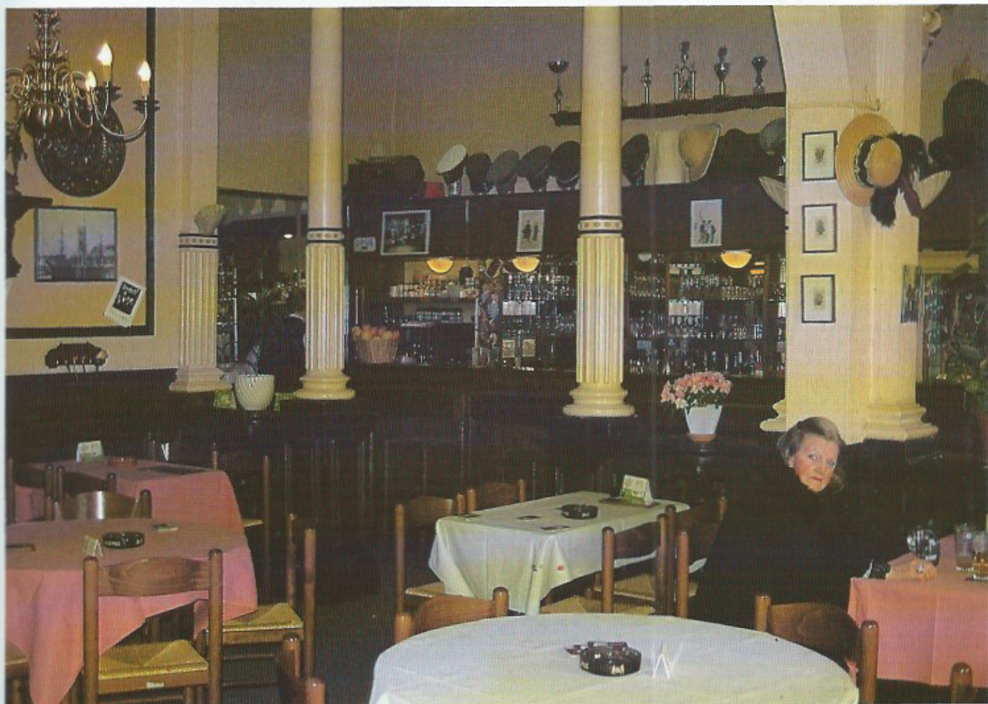
Een sfeer van gezellige voornaamheid en nostalgie naar de Koningin der Badsteden maken Le Chatelet uniek.

naar het glorieuze verleden van Oostende. Deze langs de Nieuwpoortsesteenweg gaf destijds toegang tot het hotel. Boven de deuren lezen we hier spreuken als «Tarde venientibus assa» (voor wie te laat komt blijven slechts de benen over) en «Quomodo vales» (hoe maak je het?) De «Salve» (salut of welkom) hangt hoog in het cafeetje zelf.