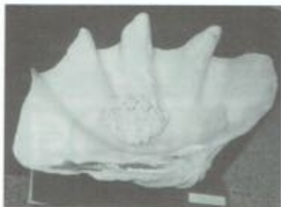
Tridacna gigas schelp. (Zie pagina 28)

Michel LANSENS Unesco-vormingscentrum Koksijde