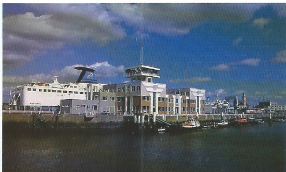
Overzichtsbeeld van het loodswezen aan de Churchillkaai.

Deze beeldende benadering die inhaakt op de symbolische draagkracht van deze plaats en op de ruimtes zelf, versterkt uiteindelijk datgene waarnaar in het gebouw met architectonische middelen