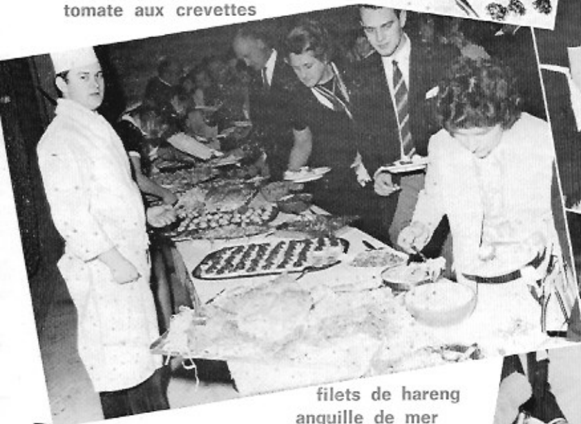
saumon en belle-vue tomate aux crevettes