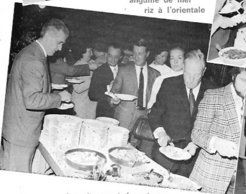
champignons à la grecque cœur de palmier macédoine de fruits aux liqueurs