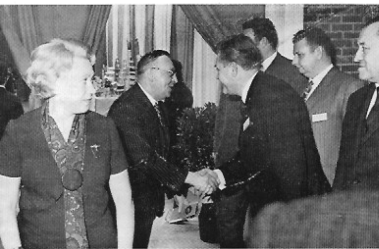
7 Welkom aan onze gasten! - Soyez les bienvenus!