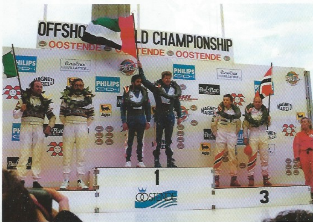
Een internationaal getint podium.