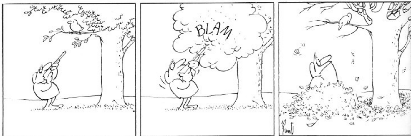
Perfesser, van Jan van der Aa (Punt).

redacteur zou het nooit in zijn kop halen om 'reclame' te maken voor een tekenaar van een concurrerend blad. Gelukkig kan dat nu allemaal zonder problemen."