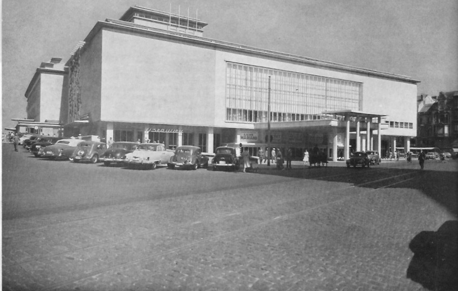
Casino-Kursaal te Oostende. - Hoofdingang aan de kant van de stad. - Op de grote centrale luifel werd voor enkele weken een beeldhouwwerk geplaatst van Grard.