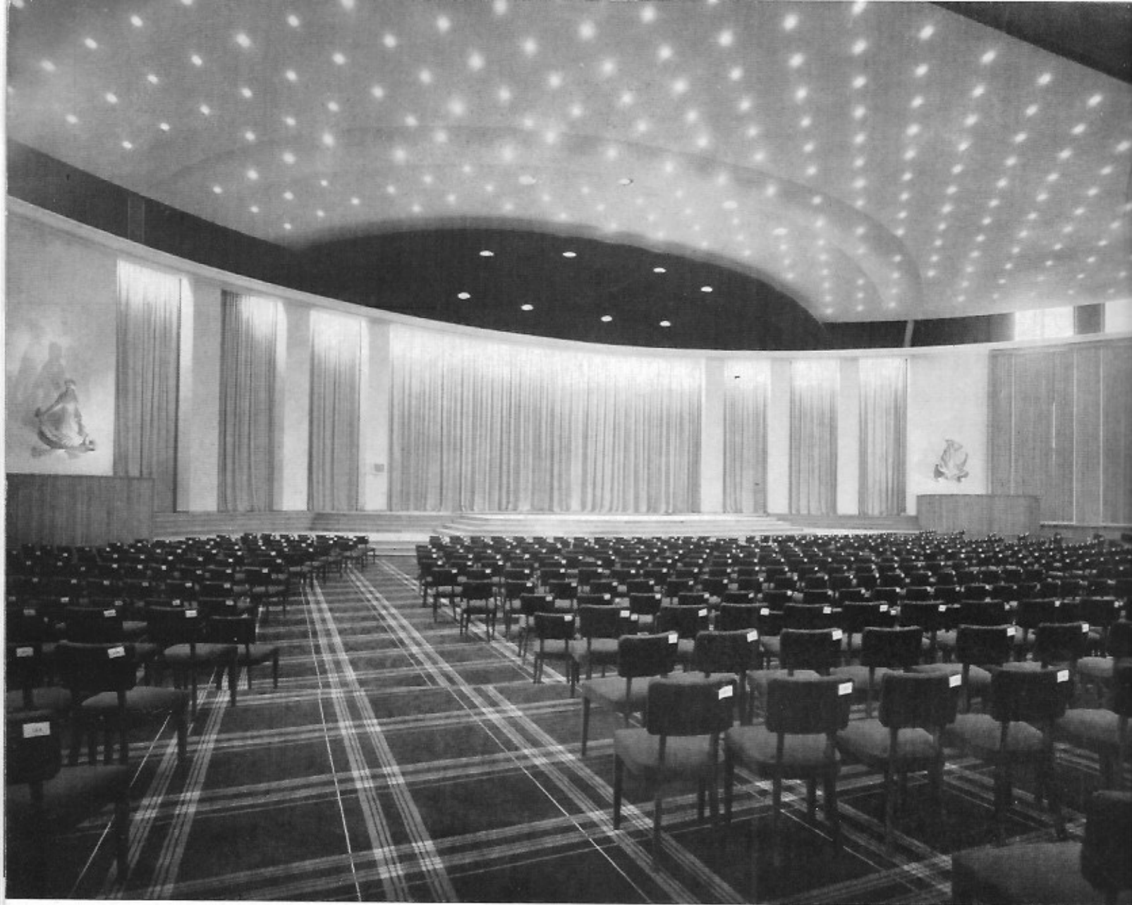
Grote concertzaal, 50 bij 60 m. biedt plaats aan 2500 personen. Bewegbaar podium, geschikt zowel voor concerten als voor operavertoningen.