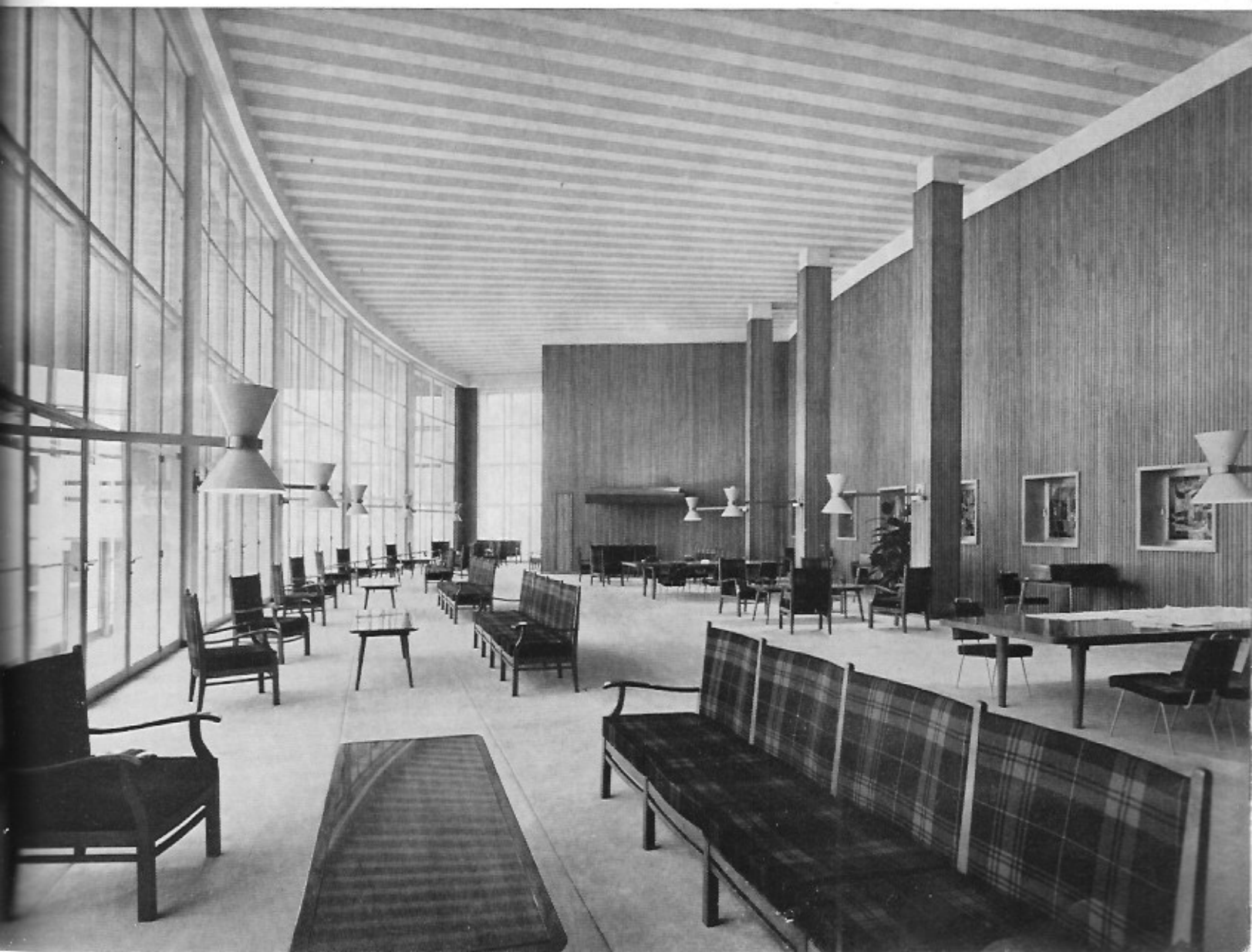
Leeszaal, aan de westzijde gelegen, met uitzicht op de zee en het strand.

Een stad als Oostende, in het centrum van de Belgische kust gelegen, en sedert vele decennia wereldbekend als badplaats, heeft behoefte aan een uitstekend ingericht milieu, waar ook het culturele leven, in voordrachten, filmvoorstellingen, concerten en tentoonstellingen kan gevoed worden. Sedert de opening van de nieuwe Kursaal heeft Oostende in die zin in ons eigen land en daarbuiten de vermaardheid nog opgedreven. In verband met de culturele manifestaties die in het Casino plaats grijpen, hoort men wel eens, dat er hoofdzakelijk beroep gedaan wordt op buitenlandse artisten, en dat zo zelden onze mensen een gelegenheid krijgen met hun werk voor dit uitgelezen internationale publiek te verschijnen. Het moet zeker zeer moeilijk zijn die verhouding passend en logisch te doseren, het komt ons echter wel voor dat in de laatste jaren diverse pogingen werden aangewend om aan die gerechtvaardigde wens tegemoet te komen. De exposities die deze Zomer in de kursaal worden ingericht liggen trouwens in de lijn van deze pogingen. De taak en de roeping van de culturele directie van het Casino is in deze dan ook zeer groot. Met de foto's die hier volgen, geven wij enkele beelden van het Casino, een paar buitenzichten, en enkele binnenzichten, waarin telkens de soberheid zal opvallen en het weren van het bijkomstige, waardoor alleen overblijft : ruimte en rust.