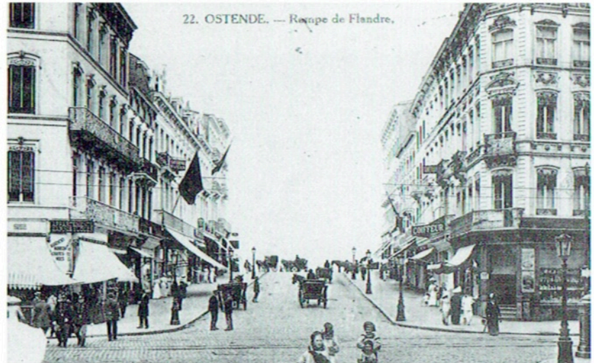
Hoek Vlaanderenstraat - Van Iseghemlaan. In het huis op de hoek rechts woonde Ensor tot 1917.