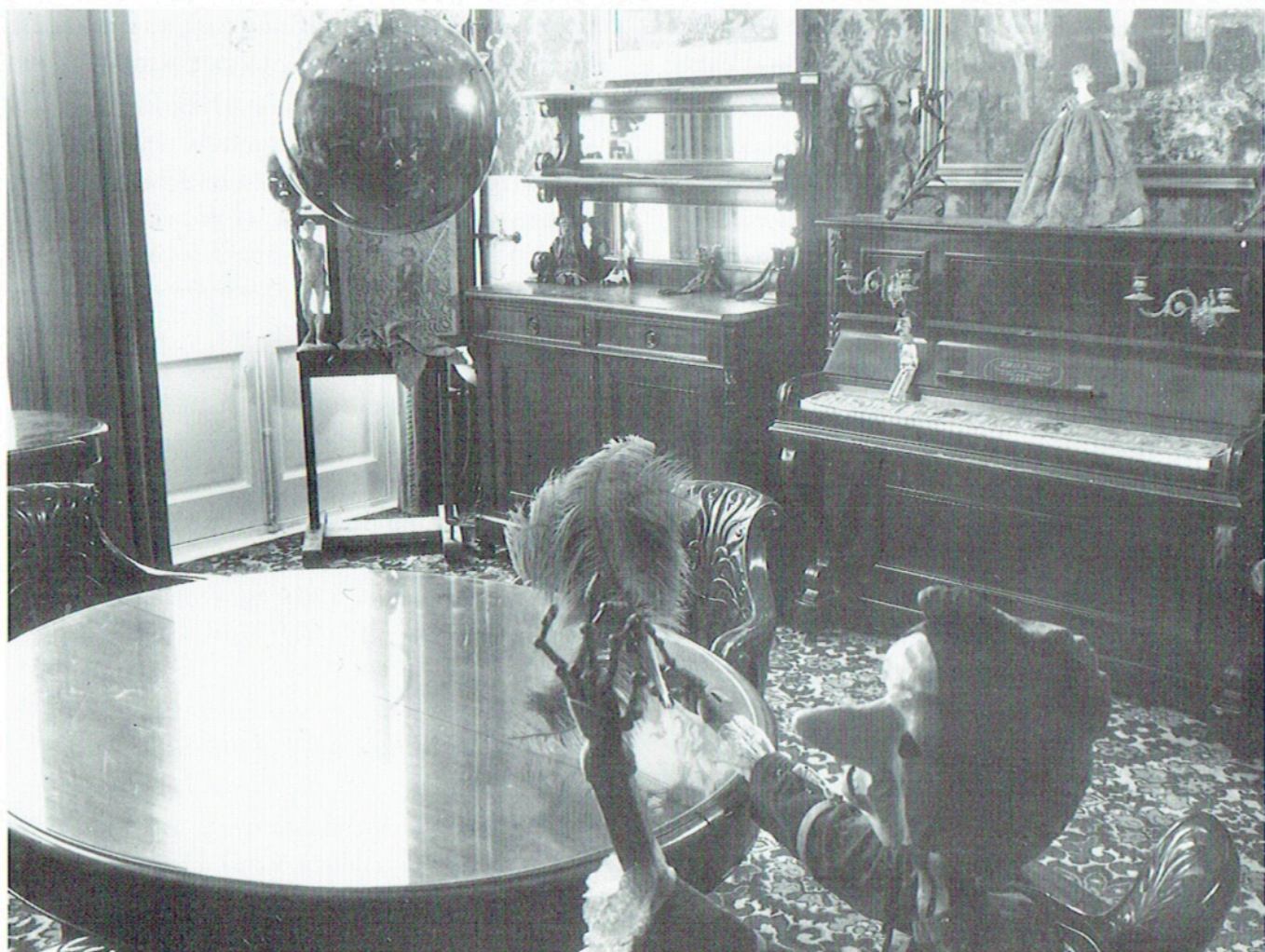
Het blauwe Salon