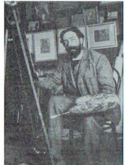
Ensor in zijn atelier - 1893