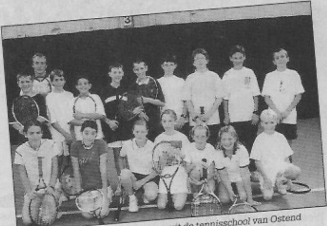
Een groep veelbelovende jongeren uit de tennisschool van Ostend Tennis Club.