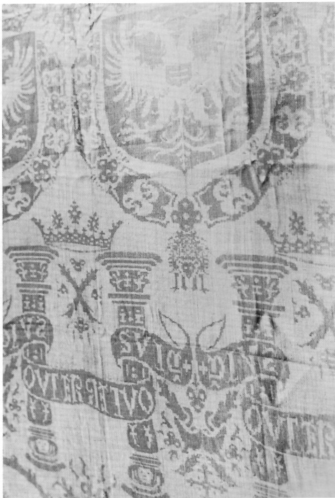
Tafellaken met het Gulden Vlies. Dit damastweefsel werd door de inwoners van Kortrijk aan Karel V geschonken. (Eigendom Stadsmuseum Kortrijk).