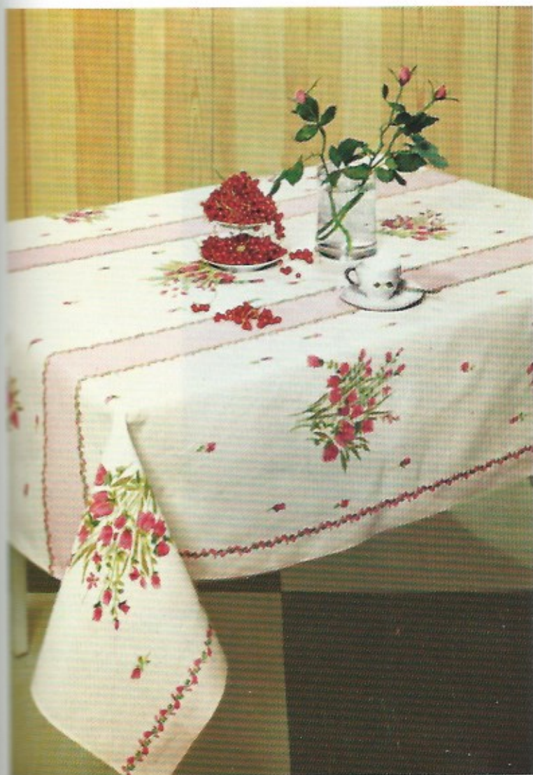
Voor pic-nics, openluchtmaaltijden, voor ontbijt of vieruurtje, dit frisse tafelkleed in wit katoen met roze banen; de banen zijn afgezet met een galon van bloempjes in jacquardborduursel. Op de witte vlakken zijn grote bloemtulpen gedrukt in dezelfde kleuren (De Witte - Liétaer).