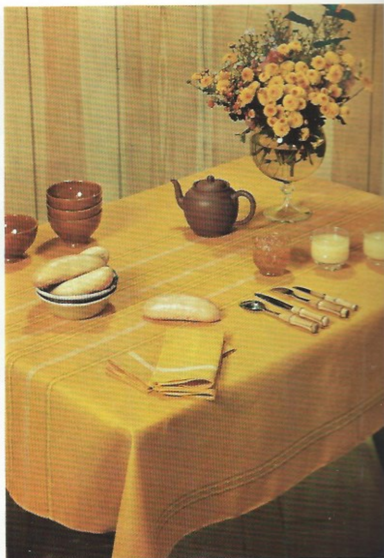
Een gezellig en smaakvol tafelkleed in goudgeel vlaslinnen, versierd met een ingeweven fantasiegalon. Bijpassende servetten (De Witte - Liétaer).