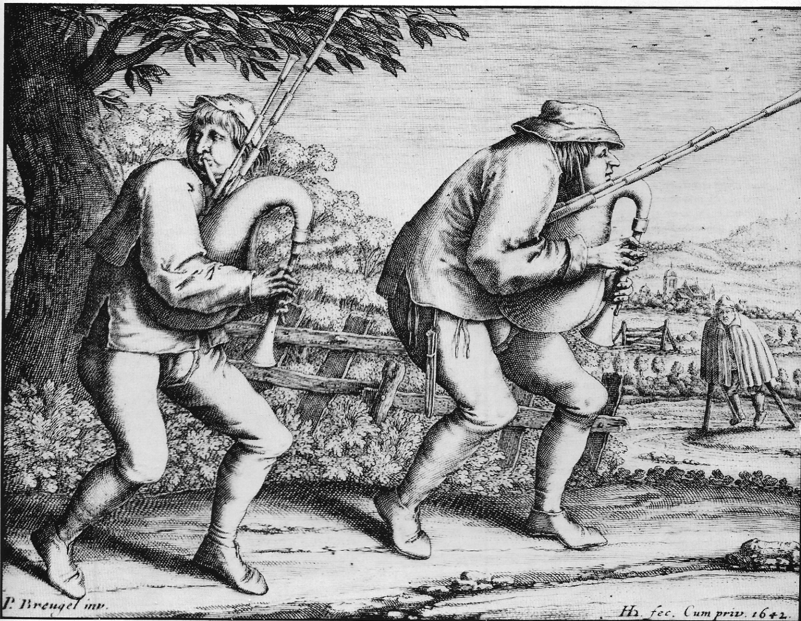
„Voor aen gaen dese Speel-lieden ofte Moeselaers, speelende op Sack-pijpen, daer nae volgen de Pelgrims...”, Pieter Breughel (1520-1569): 'De Dans der Bedevaarters', uit de uitgave van 1642 door Hondius.