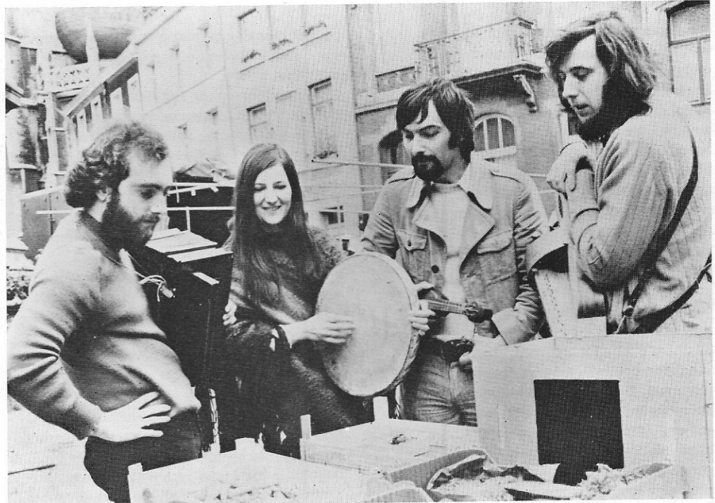
't Kliekske