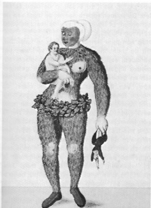
Wilde vrouw en Wilde man. Schembartlaufen Nürnberg, 1539.