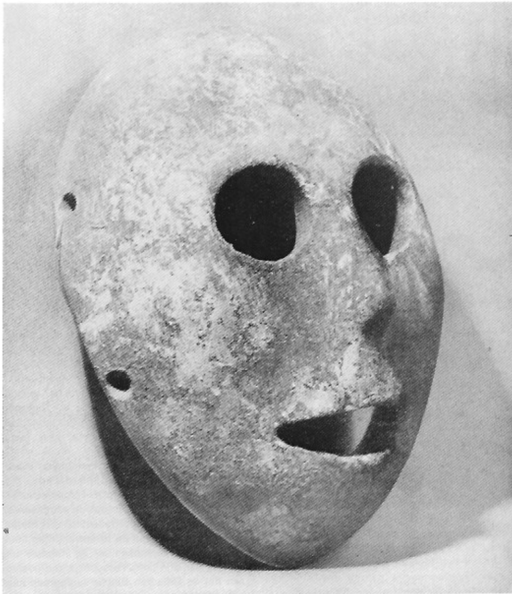
Masker in kalksteen, gevonden in de vallei van Hebron. (Israël) 1600 v. Chr. (Bijbelmuseum Jerusalem).

ruimte rond hen vrijgemaakt en het spel begon. De berenleider deed zijn uiterste best om het dier te bedwingen, dat tot driemaal toe neerviel om dan met een plotse ommekeer zijn meester omver te werpen.