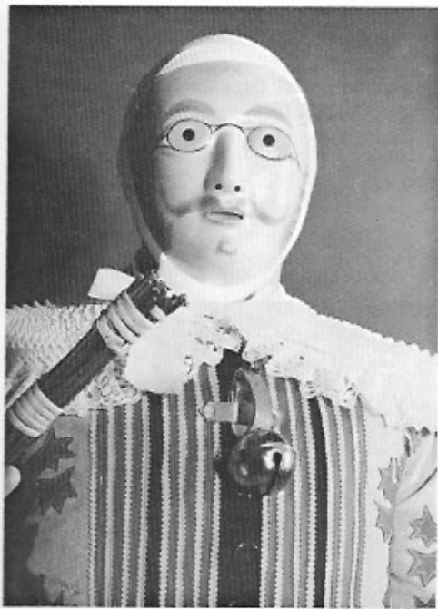
Gille met masker. Binche (voormiddag van het carnaval). Museum Binche.