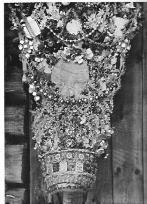
'Schiache Percht'. Gastein, Oostenrijk. (Lelijke Percht), 1939.