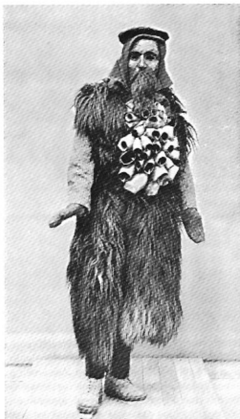
'Mamutone' uit Mamoiada (Sardinië). Museum Binche.

het werk van de duivel en het bedrijven van heidense praktijken. Sedert meer dan tweeduizend jaar worden in vele talen de kwade geesten met dezelfde termen aangeduid als de maskers. Arlekijn, het bekende personage uit de Commedia dell'Arte dankt wellicht zijn naam aan een Herlechin of Hellequin, de duivel die in de barre wintermaanden de troep huilende zielen aanvoert, die door de lucht jagen. De 'Mesnie Hellequin' is een van de volkse mythen die de verbeeldingswereld van onze voorouders openbaren. De geesten-stoeten van 'vrouw Perchta' en 'vrouw Holda' roepen evenals de wilde jacht van de duivel Hellequin de razende doortocht op en verwekken de angst voor het leger der schaduwen.