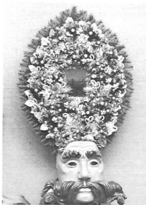
Masker van 'Scheller'. Imst, Oostenrijk. Museum Binche.