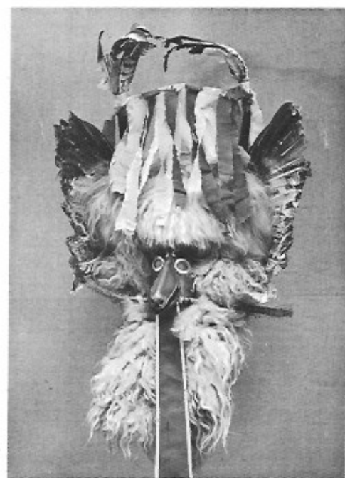
Masker van 'Kurent'. Ptju, Yoego-Slavië. Museum Binche.

landse zee ter plaatse verworven werden. Het blijkt dat deze Turkse maskerades, in weerwil van de islamitische godsdienst, talrijker zijn dan op het eerste gezicht lijkt. De meeste van deze vermommingen vindt men ook elders in Europa terug: zo verschilt de man gehuld in een beddelaken in wezen niet van de 'Blancs-Moussis' (in lokaal dialect: in het wit gekleed) van Stavelot. Er is nog de kameeldrijver met zijn kameel, met klapperende kinnebak, die door een van de dragers in beweging gebracht wordt. Tot deze streekgroep behoort ook een tweevoudig personage, door een persoon uitgebeeld: de man die een ander op de rug draagt.